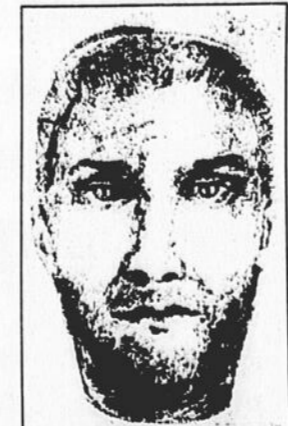
Voici le portrait-robot du voleur au dépanneur de Howick.