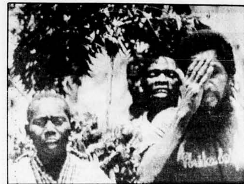
AFP, UPI et Reuters PORT-AU-PRINCE

LA PRESSE, MONTREAL, MERCREDI 8 JUILLET 1987