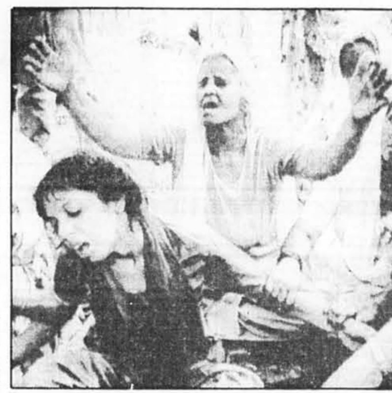
Des parents des victimes expriment leur douleur, à l'hôpital de Chandigarh.