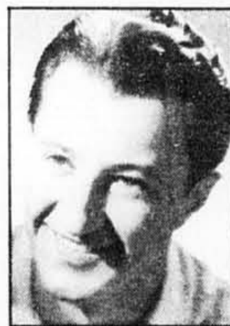
Photothèque, La Presse (1950)

Le dimanche 20 décembre, Radio-Canada, le réseau TVA, Radio-Québec et Télévision Quatre-Saisons diffuseront simultanément un spectacle de gala.