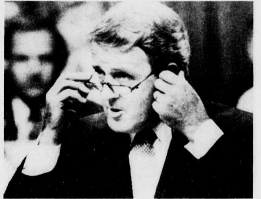
Le premier ministre Brian Mulroney a eu à faire face à un manque de solidarité chez les députés de son parti.