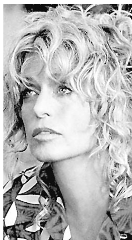
Parmi les personnalités étrangères invitées cette année au Bal de l'Opéra de Vienne, figure l'actrice américaine Farrah Fawcett.

À l'extérieur de l'Opéra et dans le centre de Vienne, plusieurs milliers de manifestants sont attendus, ainsi qu'un millier de policiers.