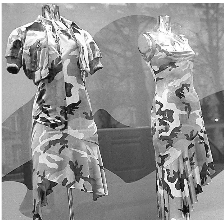
Aux dernières collections, John Galiano pour Christian Dior a joué avec l'idée d'associer à un univers masculin des silhouettes, des tissus féminins et des formes sexy.

Le résultat fonctionne au-delà des espérances, indique-t-on chez Dior, dont les vitrines des magasins ont été redécorées aux couleurs marron, vert, beige et noir. En deux mois, les produits mis en boutiques dans le monde se sont vendus à 70 %. « Un record », selon la maison de luxe.