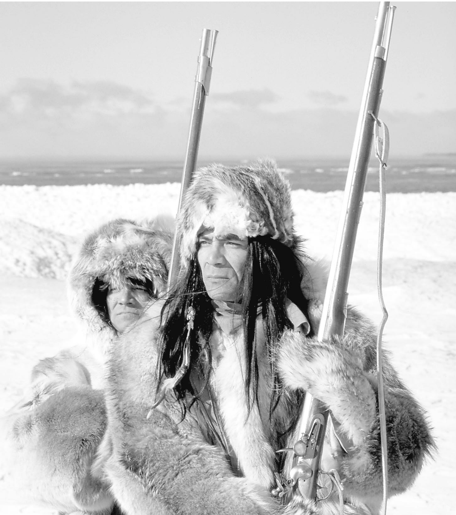
Depuis le 22 octobre, date de la diffusion du premier épisode de la série Le Canada : une histoire populaire , à Radio-Canada, le débat se fait à coups de lettres ouvertes dans les journaux.

MATT STONE et Trey Parker, les créateurs du décapant dessin animé South Park , remettent ça avec une nouvelle comédie de situation qui se déroulera à la Maison-Blanche, rapporte le magazine Brill's Content . Le titre : That's My Bush ! , Bush comme dans George W. Ça promet. La diffusion de l'émission doit commencer en avril sur la chaîne américaine Comedy Central. Elle était prévue pour février, mais le fiasco des élections américaines a retardé le choix du président et, par le fait même, l'identité du personnage principal de l'émission de Stone et Parker. L'émission n'est pas en ondes que déjà, elle suscite la controverse. Comedy Central a demandé aux créateurs de retirer de l'émission toute référence aux jumelles Bush de 19 ans, Jenna et Barbara, que Stone et Parker faisaient passer pour deux « amantes lesbiennes incestueuses ».