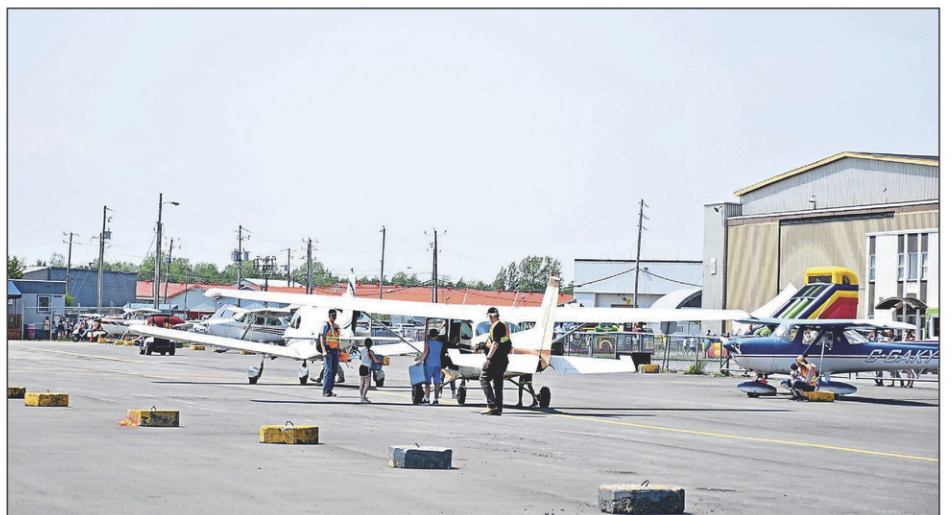
Les décollages et les atterrissages se sont suivis à un rythme soutenu toute la journée.