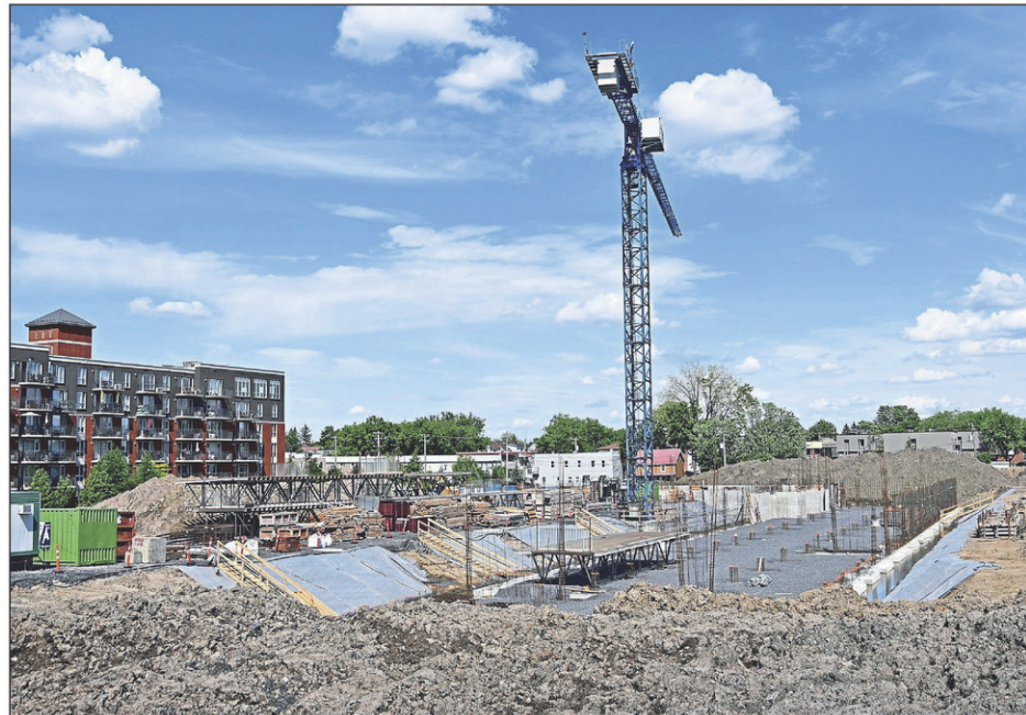
La livraison des 187 appartements de la phase 2 du complexe Evol Saint-Jean est prévue pour le 1 er juillet 2023.

Ce projet vient doper les statistiques de mises en chantier à Saint-Jean-sur-Richelieu. Cela n'est toutefois pas exclusif