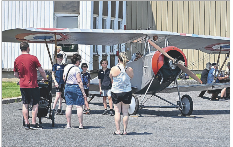
Jeunes en vol invitait les visiteurs à s'approcher d'appareils inédits, comme cette réplique d'un biplan de la Première Guerre mondiale.