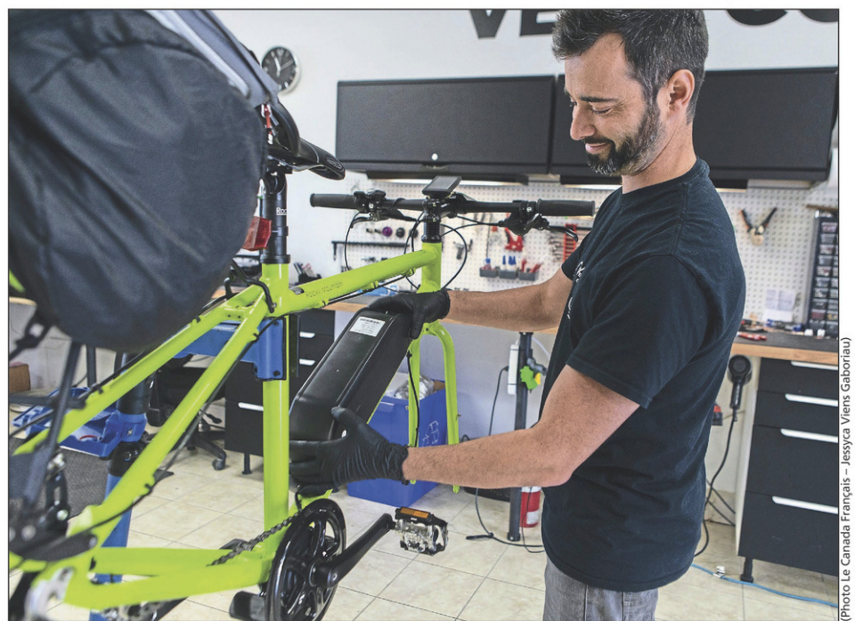
La batterie peut s'installer directement sur le cadre du vélo, là où va normalement le support à bouteille ou être installée sur un support à l'arrière de la selle.

« Une fois le système en place, les gens