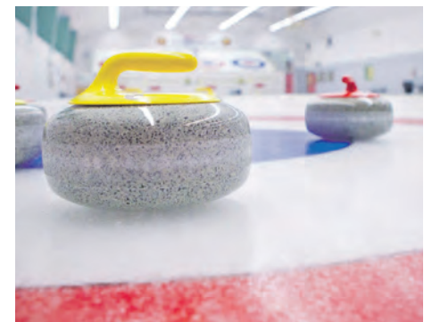
Le club de curling de Baie-Comeau a récemment fêté ses 85 ans.