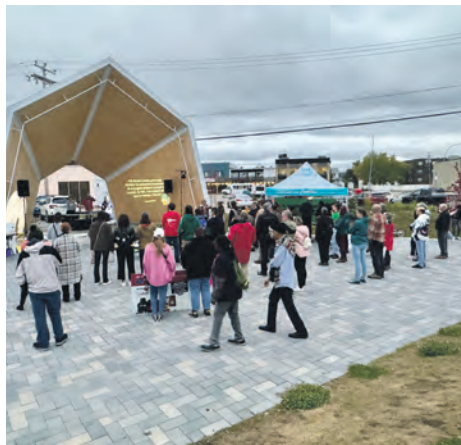
Une cinquantaine de personnes étaient réunies pour soutenir les organisations à la tête de la mobilisation.

Cette manifestation a été lancée par Mères au front – Baie-Comeau, la Table des groupes populaires de la Côte-Nord et la Corporation de développement communautaire de la Côte-Nord.