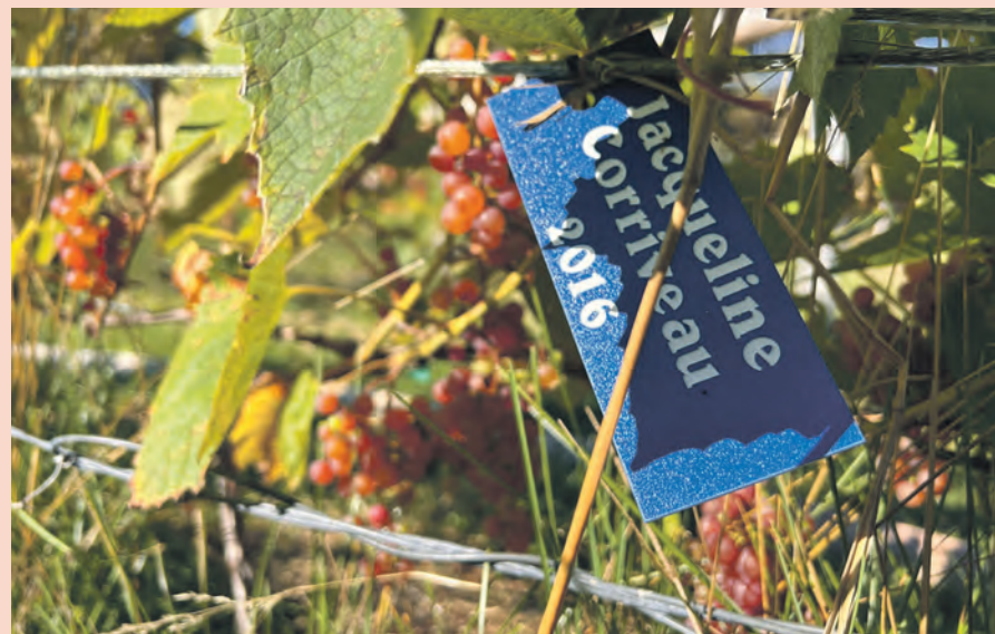
Les marraines et parrains ont un pied de vigne à leur nom.

Il aimerait mettre en marché ses premières bouteilles «le plus tôt possible», mais demeure prudent avec l'échéancier.«On travaille avec ID Manicouagan. Il faut d'abord faire l'aménagement du chai et de la cuverie, ce sont de bonnes dépenses. Tous les ans, je me mets des objectifs, mais ce n'est pas facile d'aller chercher du financement, le nerf de la guerre, pour faire pousser de la vigne sur la Côte-Nord! C'est une chose qui est peu commune», rigole-t-il.