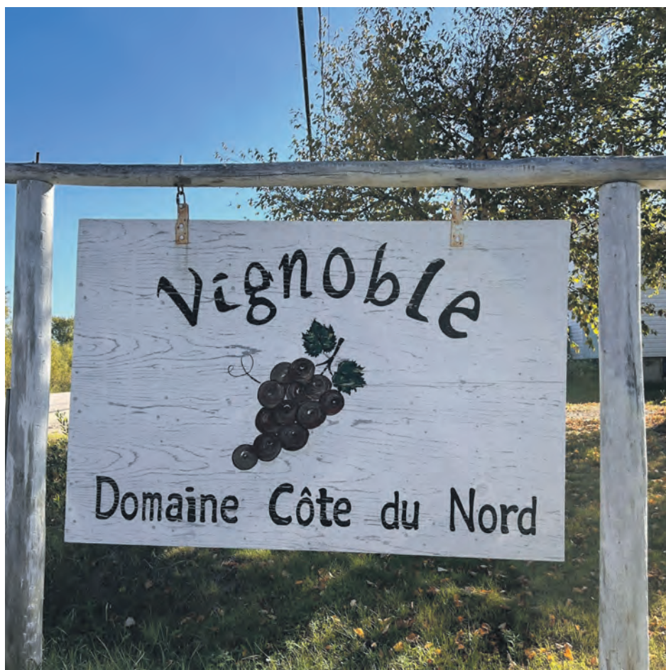
On ignore quand le Vignoble Domaine Côte du Nord pourra accueillir ses premiers visiteurs, mais le volet agrotouristique est dans les cartons.