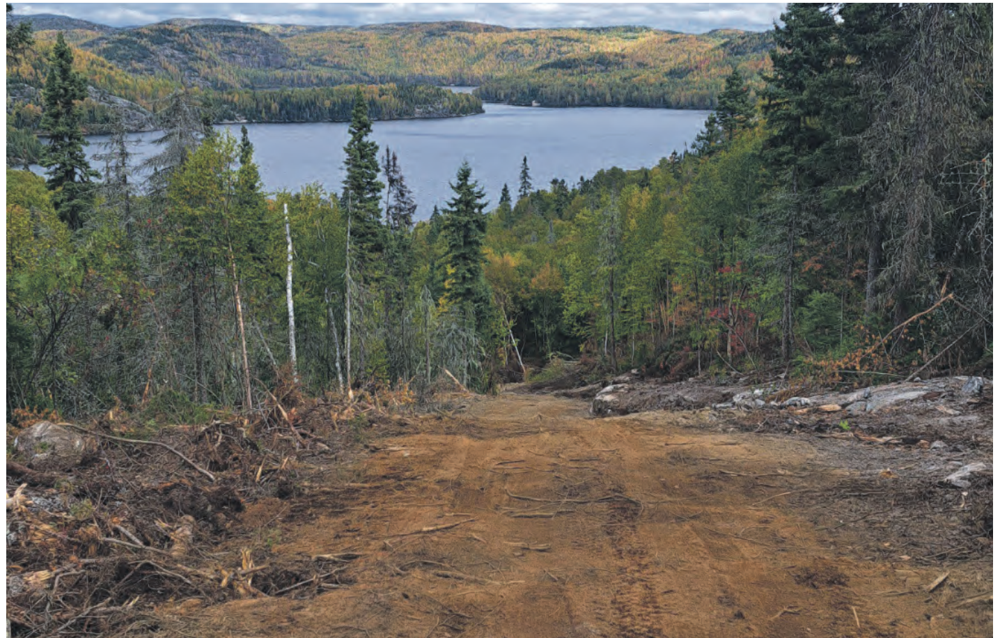
Prise de vue sur le nouveau tracé du sentier de motoneige TQ3.

Théoriquement, le sentier sera prêt pour y rouler cet hiver. Techniquement, il y aura du travail pour les