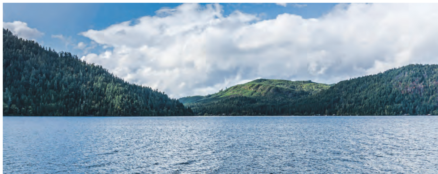
La MRC de Manicouagan a ciblé cinq aires protégées potentielles sur son territoire.

La MRC a aussi mis le doigt sur une parcelle près de la Rivière Papi-nachois, le Lac Sans Baie près de