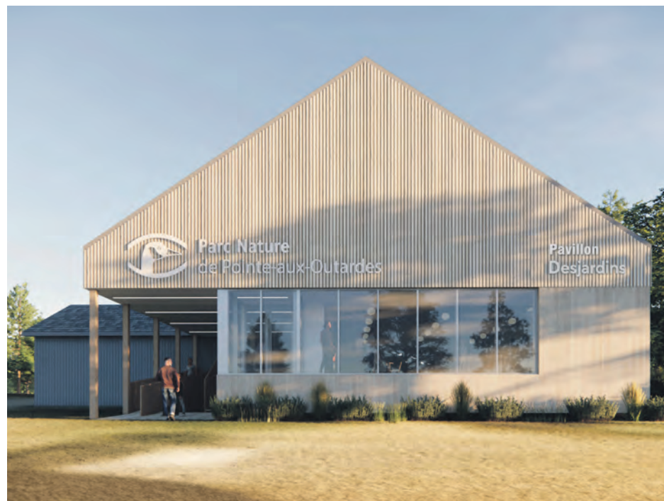
Voici à quoi ressemblera le nouveau pavillon.

En plus du nouveau pavillon d'accueil, le projet prévoit la création d'un centre d'interprétation sur la Réserve aquatique projetée de Manicouagan,