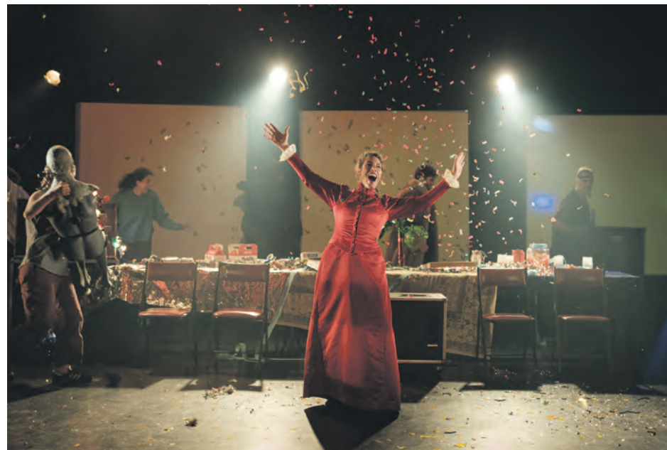
Le PàP de Montréal a présenté sa pièce Pendant que les champs brûlent en première mondiale à Baie-Comeau le 27 septembre.

La représentation utilise des extraits audio et vidéo recueillis au cours des quatre dernières années, renforçant l'impression d'un voyage à travers les enjeux de l'exploitation des ressources naturelles.