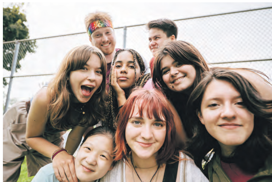
L'équipe de Tel-jeunes sera à Baie-Comeau le 12 octobre pour rencontrer les adolescents de la région.

L'organisme provincial est connu des jeunes de 12 à 17 ans depuis sa création en 1991. Toutefois, l'importance de se faire connaître à nouveau est importante pour l'équipe. Des intervenants formés sont à la disposition des bénéficiaires, 20 h sur 24 et 7 jours sur 7.