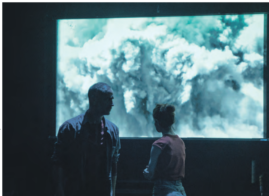
Le Centre des arts de Baie-Comeau est coproducteur de la pièce.

«Les gens nous disaient souvent que leur rapport à l'espace, au temps et à la distance était complètement différent ici. Le lien avec la nature est très clair», partage-t-il. Ces observations ont nourri le sujet central de la pièce : le rassemblement et notre relation aux ressources naturelles.