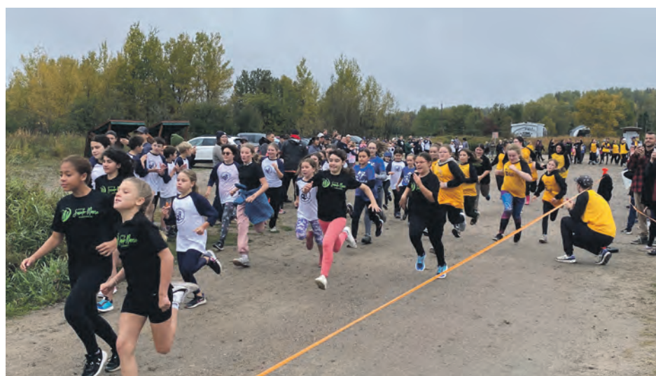
La Coupe de la Péninsule ne se tient pas dans la même municipalité chaque année. Pour sa 4 e édition, elle a eu lieu au quai de Ragueneau, le 27 septembre.

L'école Sainte-Marie de Ragueneau a quant à elle vu l'engagement de ses élèves être souligné par la remise de la bannière dans cette catégorie pendant que l'école Richard a obtenu la bannière de la persévérance. Finalement, l'école Les Dunes a reçu la bannière de l'esprit d'équipe.