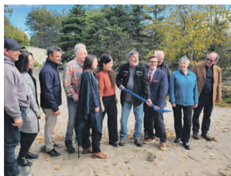
Une pelletée de terre pour la construction du nouveau pavillon a eu lieu le 30 septembre au Parc nature de Pointe-aux-Outardes.

Le pavillon s'inspirera des modèles scandinaves, avec une touche régionale, et il arborera un style chaleureux, moderne et épuré. En cohérence avec ses valeurs, le Parc nature privilégiera les aspects du développement durable pour sa construction.