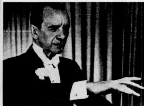
Malcolm Sargent Vaughan Williams

malcolm sargent dirige des oeuvres de beethoven et de vaughan williams