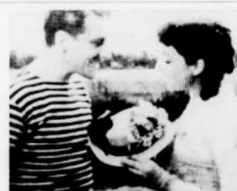
Au "Festival Renoir", le mardi 2 février à 11 heures, "Une partie de campagne".