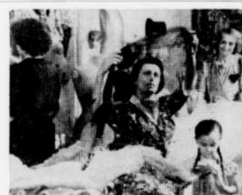
"Bellissima" de Visconti sera présenté à "Cinéma", le vendredi 5 février à 11 h. 30.