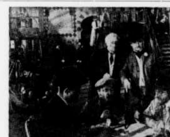
Le film à l'affiche d'"Images en tête", le samedi 30 janvier à 4 h. 30, est "Le silence est d'or" de René Clair.