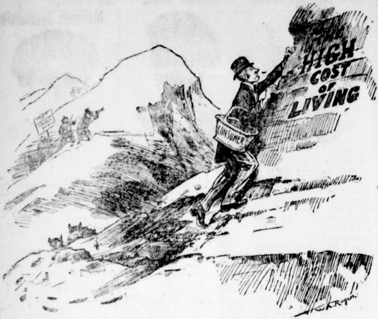
COURAGE! LE PIRE N'EST PAS ENCORE FAIT! — ("New-York Herald.")