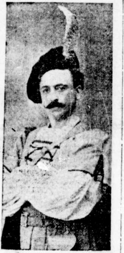
X. MERCIER, ténor canadien

Paris, 23 déc. 1909.-Le dernier courrier d'Algérie nous apporte les échos du très grand succès que remporte actuellement, au Grand Théâtre de Constantine, l'excellent ténor canadien F. X. Mercier. Encaissé pour tenir en titre l'emblème de fort ténor et chanter tous les rôles du grand répertoire, Mercier a débuté dans "Les Huguenots", et il a conquis dès les premiers instants l'admiration des Constantinois. "J'ai sous les yeux le compte rendu de cette soirée publié par La Dépêche Constantinoise". "Mercier, dans le rôle de Raoul de Nangis, conquis de suite le public par la simplicité et l'expression de sa jolie voix qui se joue des traits amoncelés comme à plaisir dans la partition de Giacomo Meyerbeer." "Qu'on me permette de citer quelques autres extraits de journaux qui feront voir que Mercier ne s'en fait pas tant à ce premier succès. Au lendemain d'une représentation de "Paillassé", "L'Indépendant" disait : "Il semble que Mercier s'applique à nous laisser le plus de rubert possible. C'est du moins ce que nous avons cru comprendre après cette représentation."