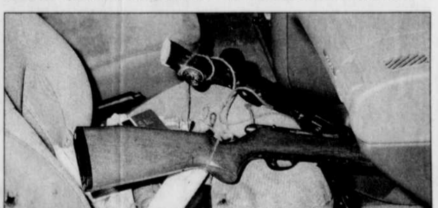
Les deux armes retrouvées par les policiers étaient chargées à bloc.

Une sorte de « carnage », a rappelé le procureur de la Couronne, James Rondeau. Neuf jours plus tard, André Beaulieu devait sortir de sa cachette de Sainte-Rita, une municipalité située à environ 45 minutes en automobile de Trinité-des-Monts pour être arrêté par la SQ. Deux cueilleurs de noix l'avaient alors forcé à se déplacer au moment où il était activement recherché par les forces policières.