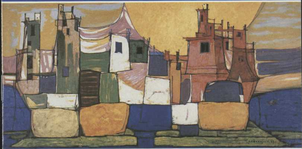
Port de mer , Paul V. Beaulieu, 1967 Collection d'œuvres d'art de la Place des Arts