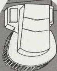
Place des Arts

un endroit élégant et confortable où vous pouvez dîner agréablement et en toute quiétude. La Table d'hôte est offerte à partir de 12,50 $.