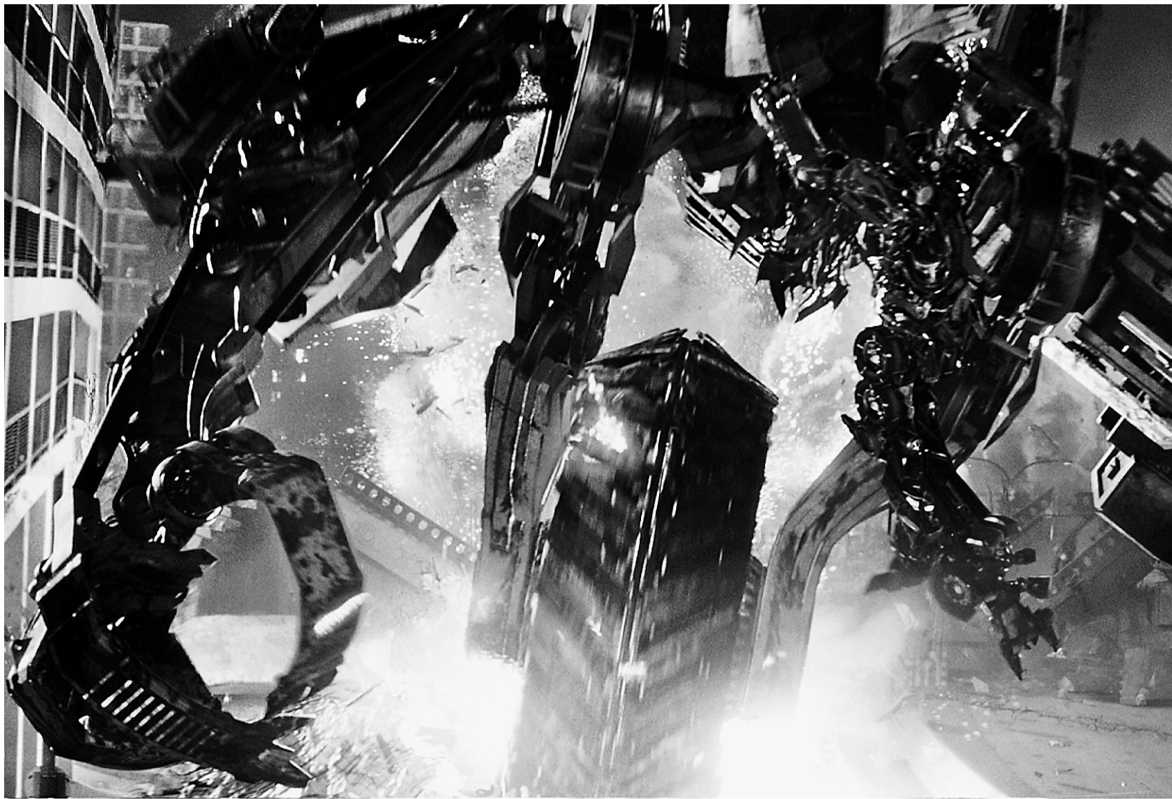
Transformers: Revenge of the Fallen relève de l'indécent gaspillage d'argent et de talents.

Ce nouveau Transformers est une farce, inutile de s'attarder sur le scénario d'une niaiserie inouïe. Une farce qui a coûté cher, trop cher. Spielberg aurait dû recourir