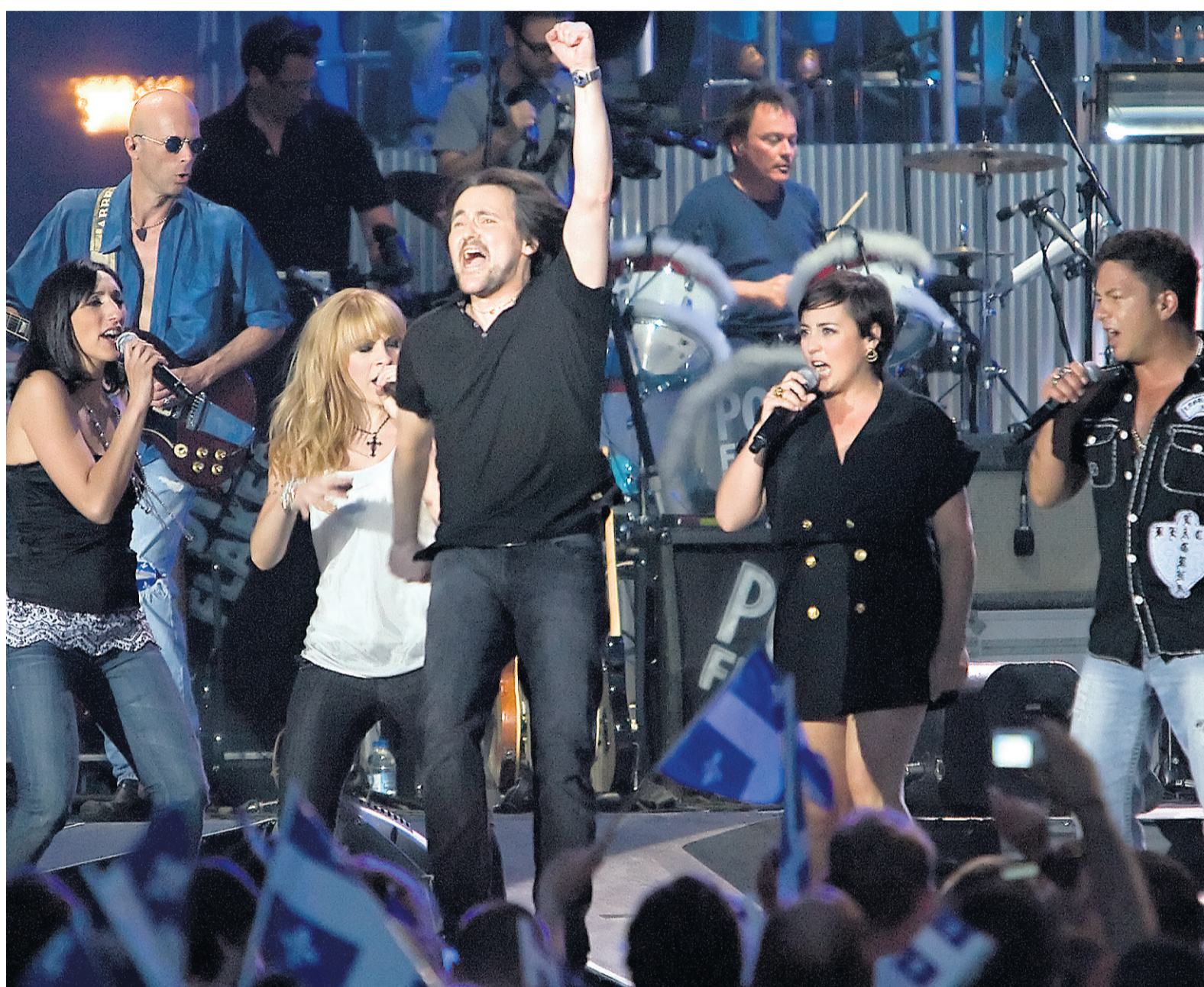
Guy A. Lepage a animé avec l'humour cinglant qu'on lui connaît le Grand spectacle de la Saint-Jean hier soir. On le voit sur scène en compagnie de Florence K., Marie-Mai et Ariane Moffatt.