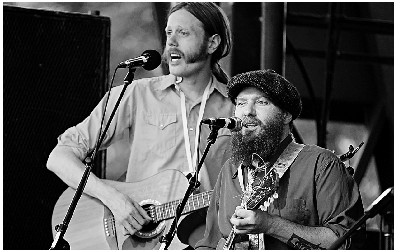
Mardi soir, les membres du groupe anglophone Lake of Stew se sont adressés à la petite foule réunie au parc du Pélican à Rosemont (et aux nombreux journalistes) en français.

de Lake of Stew avec des chansons à répondre du Carnaval de Québec. Ils s'étaient donné pour mission de déranger le show de toute manière possible et criaient « En français! En français! » Lorsqu'une caméra de télévision s'est enfin braquée sur eux, ils