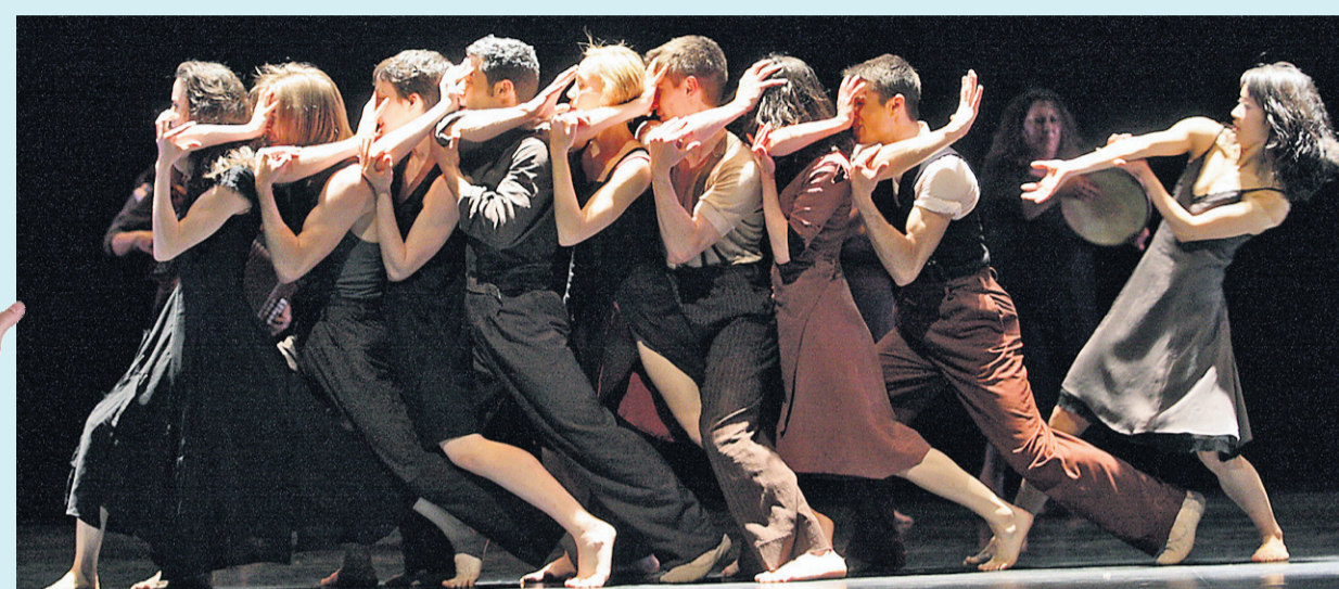
Les Grands Ballets canadiens de Montréal.