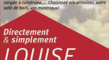
MLS 10530176, CONSTRUCTION NEUVE, Maison en rangée à construire..... Choisissez vos armoires, votre salle de bain, vos matériaux!