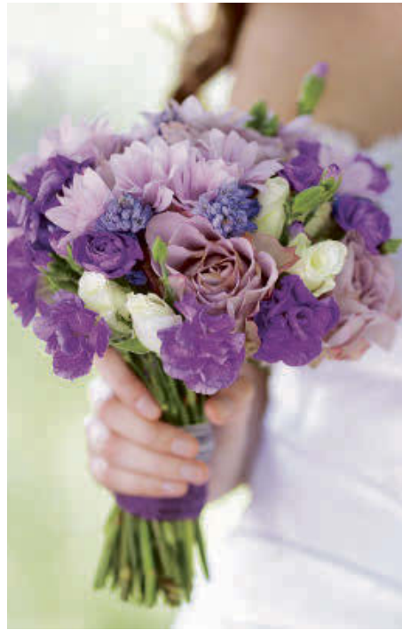
Le bouquet de la mariée doit être choisi en fonction de sa morphologie, de sa personnalité et de sa robe.