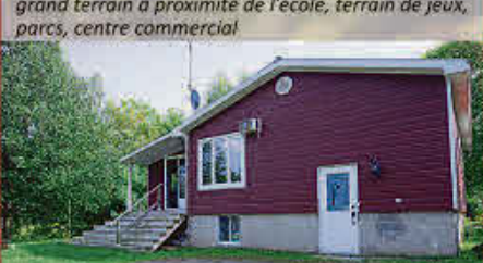
MLS 17614664, GRAND BUNGALOW, 4 chambres, grand terrain à proximité de l'école, terrain de jeux, parcs, centre commercial