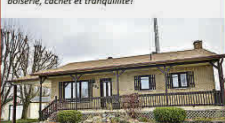
MLS 15900047, BORD DE L'EAU, Luminosité, boiserie, cachet et tranquillité!