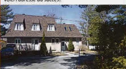
MLS 21992539, PARTEZ EN AFFAIRES, Secteur névralgique! Vous avez un projet, voici l'adresse du succès!