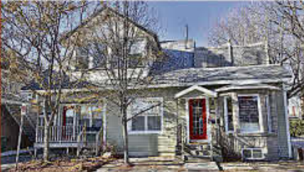
MLS 23344854, VISITE LIBRE, 1419, Hormidas-Lemoyne, Acton Vale, le 21 janvier 14:00-16:00 Impeccable, superbe cuisine, garage et piscine creusée... Vendeur motivé, prix pour vendre