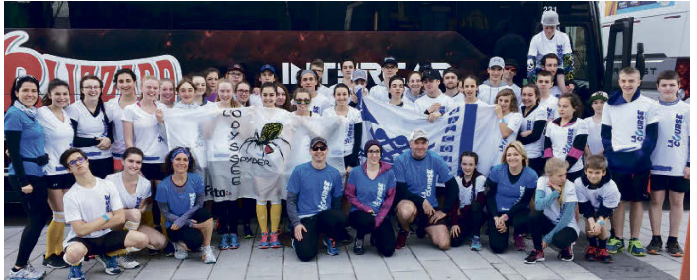
Plus de 70 étudiants de l'Odysée s'investissent dans le processus de sélection du Grand Défi Pierre Lavoie.

« Nos équipes ont déjà débuté leur saison avec brio en obtenant de bons résultats lors de leurs participations aux différents tournois. Le sport scolaire se porte très bien à l'Odysée et nous