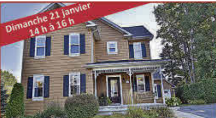
Dimanche 21 janvier 14 h à 16 h