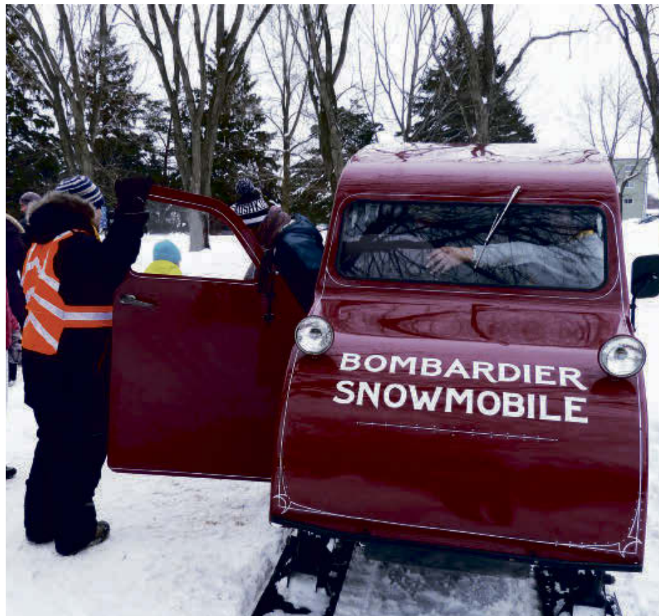
Le Musée de l'ingéniosité J.Armand Bombardier de Valcourt accueillera, le samedi 3 février, la journée d'activités « Mordus de l'hiver » dans le cadre du Festi-Val en neige.

Établi à Valcourt dans les Cantons-de-l'Est depuis plus de 40 ans, le Centre culturel Yvonne L. Bombardier présente un lieu d'exposition où cohabitent de façon dynamique les arts et lettres, les arts visuels et les arts de la scène. Il abrite aussi une Bibliothèque qui possède une vaste collection de plus de 46 000 documents en tout genre.