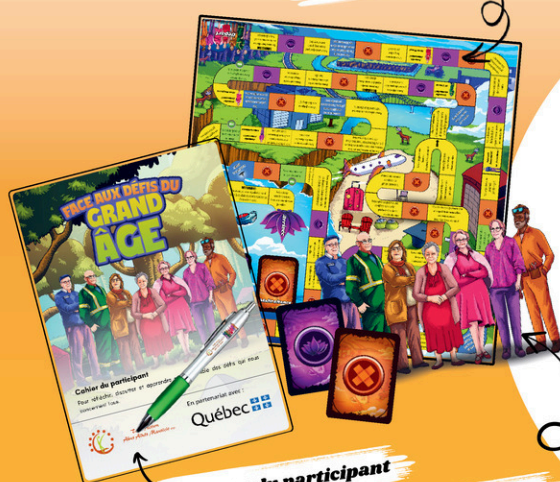
planche de jeu animée

Nombre de places limitées Réservez votre place dès maintenant au abusainesmauricie.org/tournee