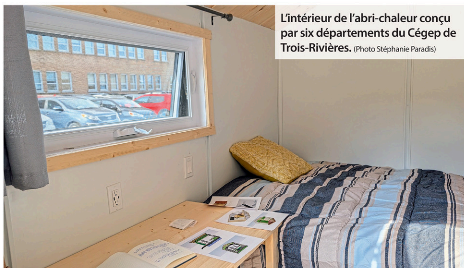
L'intérieur de l'abri-chaueur conçu par six départements du Cégep de Trois-Rivières.

en bénéficier. L'organisme Point de rue, comme plusieurs autres, a été présent tout au long du processus de création du projet.