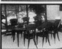
TABLE DE SALLE À MANGER

Acajou et marbre. Valeur de 10 000 $. Demande 5 000 $. 514-935-1957 514-570-2156