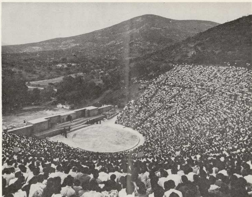
L'Ancien Théâtre d'Epidaure / The Ancient Theatre of Epidaurus

Situated in an Ancient Sacred shrine, far from any habitation, surrounded by a splendid mountain scenery covered with beautiful forests, bathed in that unique Greek light, and giving an impression of calm and meditation, such is the frame of the Epidaurus Festival representations.