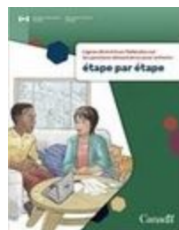
Lignes directrices fédérales sur les pensions alimentaires pour enfants : étape par étape