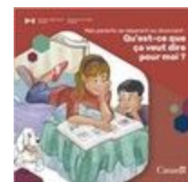
Qu'est-ce que ça veut dire pour moi?