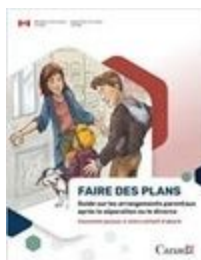
Faire des plans

Si vous souhaitez commander des exemplaires de ces documents pour votre bureau ou vos clients, veuillez contacter la Ligne d'information sur le droit de la famille du ministère de la Justice à l'adresse suivante : infam@justice.gc.ca .