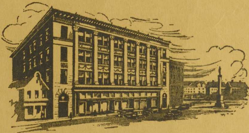
Edifice du bureau-chef: 1 rue Social, Woonsocket, R.I.

La plus puissante organisation fraternelle, catholique et française aux Etats-Unis Approuvée par les évêques des diocèses où elle a des Conseils