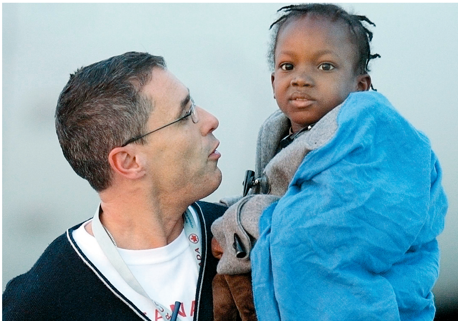
CHRIS WATTIE REUTERS

La Havane — Fidel Castro accuse les États-Unis d'avoir déployé des soldats en Haïti «pour occuper le territoire». L'ancien dirigeant cubain estime que la présence militaire étrangère nuit à la coopération internationale. Dans un éditorial publié hier par le journal d'État Juventud Rebelde , Fidel Castro écrit que «ni les Nations unies ni le gouvernement des États-Unis n'ont offert d'explication à l'opinion publique mondiale pour ces mouvements de troupes». Notant que plusieurs gouvernements et organisations humanitaires se sont plaints de se voir refuser l'atterrissage à l'aéroport de Port-au-Prince géré par l'armée américaine, il souhaite que l'ONU dirige les opérations en Haïti. — AP