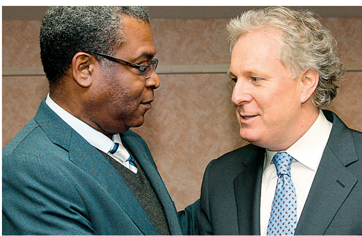
Le premier ministre haïtien, Jean-Max Bellerive, a rencontré son homologue québécois, Jean Charest, hier, à Montréal.

L'organisation humanitaire Oxfam a appelé les participants à la réunion d'urgence d'aujourd'hui à s'entendre sur un effacement de la dette contractée par Haïti auprès d'eux. L'annulation de la dette haïtienne, qui s'élève à près de 950 millions de dollars canadiens, est l'une des priorités pour la reconstruction du pays, selon l'organisation non gouvernementale. «Attendre d'Haïti qu'il rembourse des millions de dollars, alors