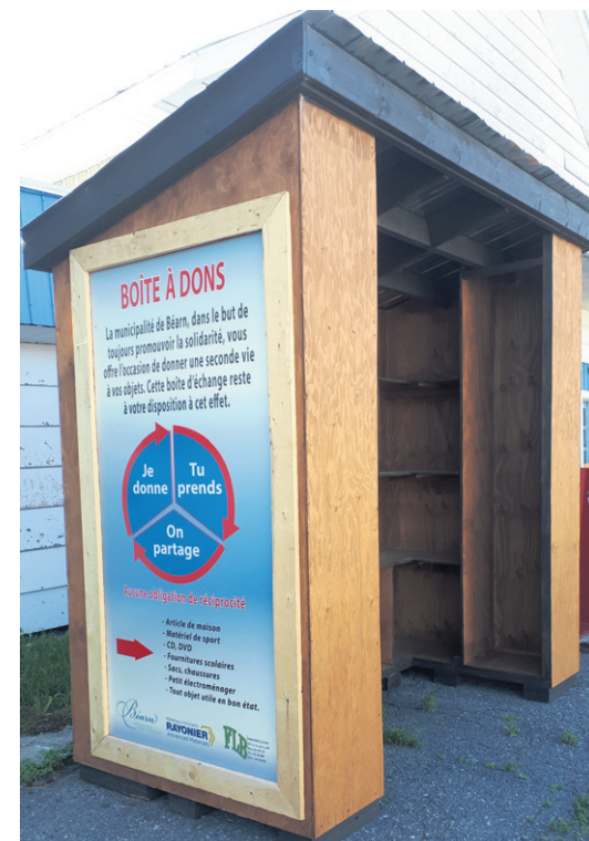
La photo a été prise lors de l'installation. La boîte était donc vide à ce moment-là.

pour s'approvisionner avant l'achat des fournitures scolaires dans les magasins. Des bénévoles passent souvent ranger la boîte et retirent les choses