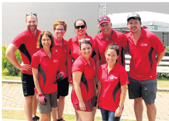
Le comité organisateur le douzième Festival des Saines Habitudes de Vie Desjardins

triathlon olympique, le triathlon sprint, le triathlon demi-sprint et le duathlon. Celles participatives regroupent le triathlon Wixx, Alexis le trotteur, l'initiation au triathlon, ainsi que la marche et concernent les personnes pour qui la motivation première est le simple plaisir de bouger. Cette édition a connu une légère baisse de participation globale par rapport à l'année précédente, soit environ douze participants de moins. Cependant, on note une forte augmentation d'inscription aux épreuves en famille.