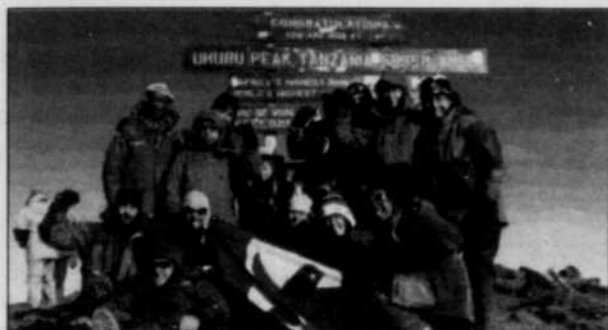
Ascension du Mont Kilimandjaro

La Société d'arthrite ne pourrait sans doute pas survivre si des milliers de donateurs ne mettaient pas la main dans leur poche pour soutenir son action. Désireuse de sensibiliser davantage de personnes à sa cause et de soutenir de plus en plus la recherche, elle organise des événements spéciaux grâce auxquels elle amasse des fonds. C'est ainsi que, pour la deuxième année consécutive, des volontaires vont partir en Tanzanie à l'assaut du Mont Kilimandjaro pour planter le drapeau de La Société d'arthrite à son sommet.