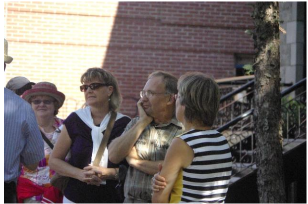
Attentifs aux moindres faits