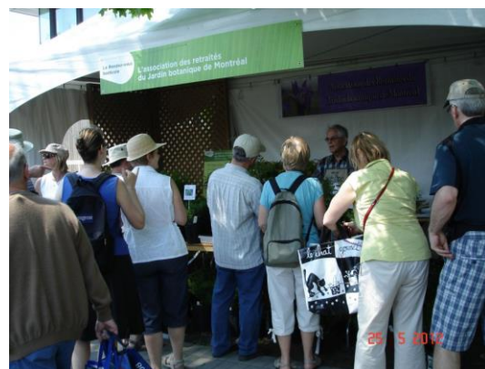
Notre président et les passionnés...