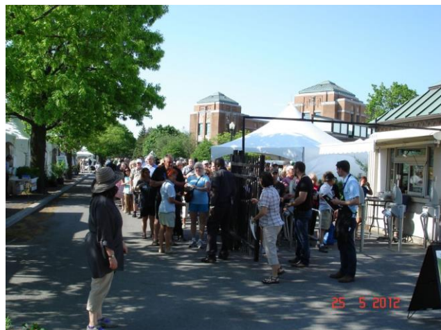
L'entrée du Jardin à 9 hres A.M. vendredi