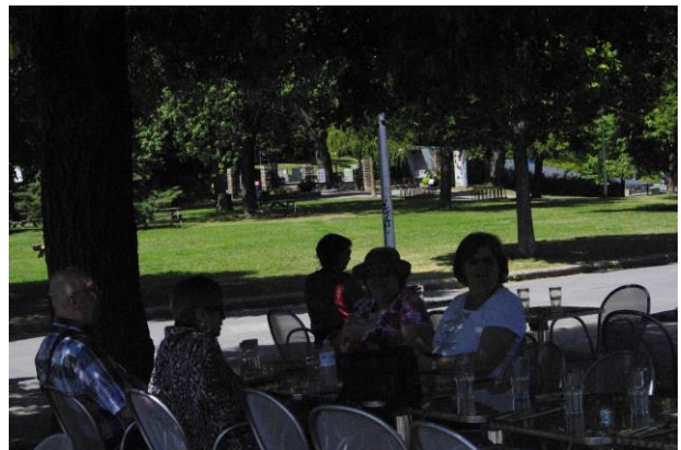
Le dîner se prenait, à l'extérieur sous les tilleuls, au resto « Espace La Fontaine »