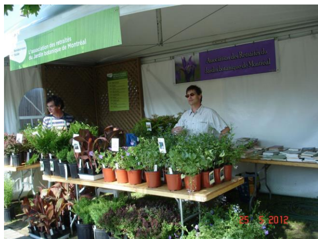
Les horticulteurs du kiosque de l'ARJBM