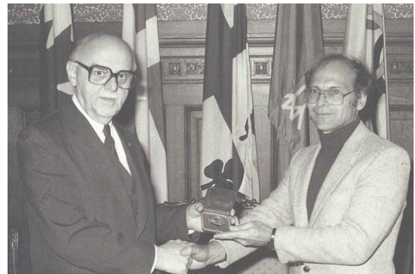
Le maire Jean Drapeau et l'auteur du texte

À ma dernière journée de travail avant ma retraite, M. le Maire Jean Drapeau m'a convoqué à son bureau pour me remettre une médaille. Voici la photo en date du 3 mai 1985