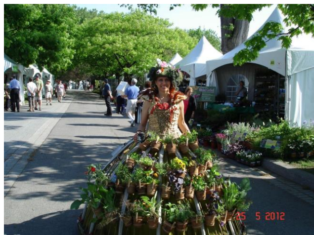
Miss fleurs 2012