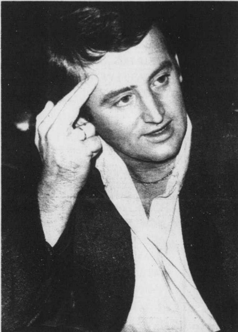
Yann Queffélec: « Pour moi, le roman, c'est une histoire à raconter, c'est un drame qui doit passionner le lecteur ».