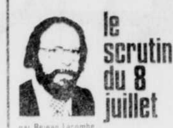
le scrutin du 8 juillet par Réjean Lacombe

C'est donc dire que l'on fausse tout simplement le débat. Il est à espérer qu'au cours des prochains jours, ces derniers changeront de tactique et se décideront à débeller leur bagage de solutions.