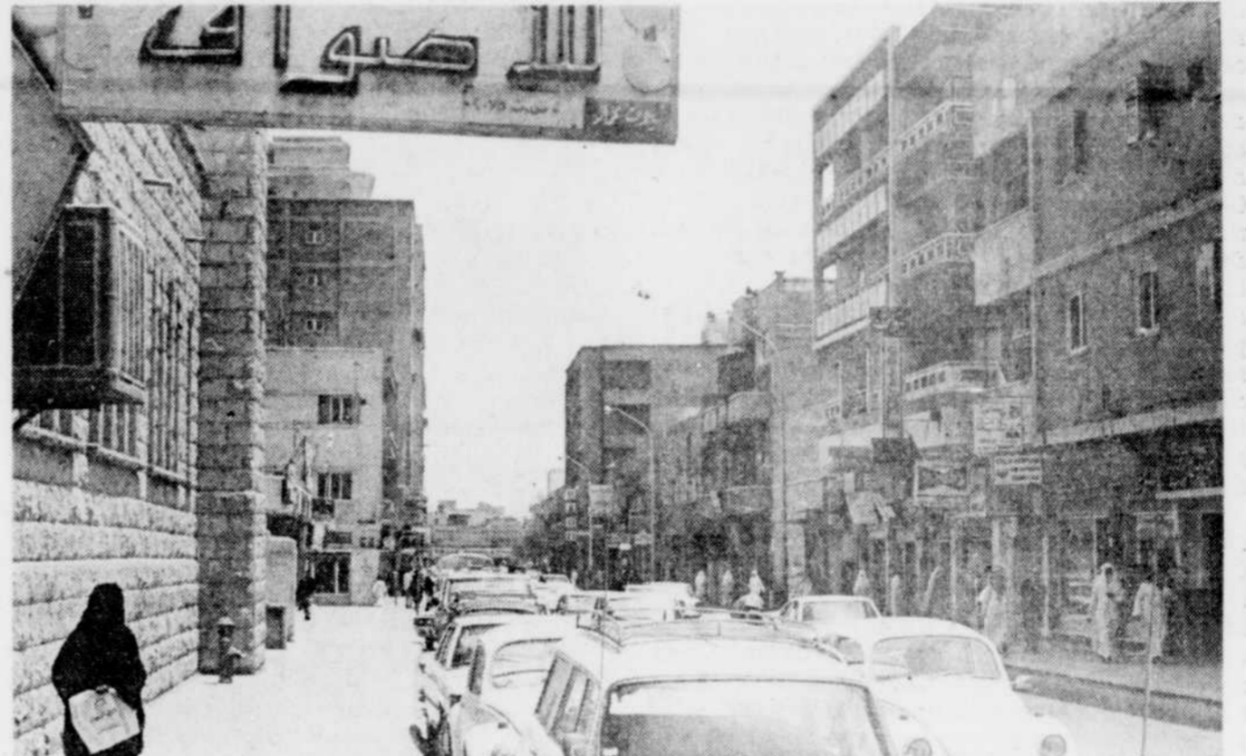
Certains observateurs, en Arabie saoudite, craignent que les valeurs traditionnelles arabes et musulmanes soient menacées par les idées étrangères qui pénètrent dans le pays en même temps que les spécialistes occidentaux de la technologie et de l'administration.

D'autres que lui, par ailleurs, n'en sont pas si certains. Et l'un des buts de l'expansion du système d'éducation, c'est d'empêcher un choc culturel qui ébranlerait la Société. Le roi Faïçal de son côté, doit lutter contre les aspects contradictoires des relations de l'Arabie saoudite avec ses voisins. Farouchement anti-communiste,