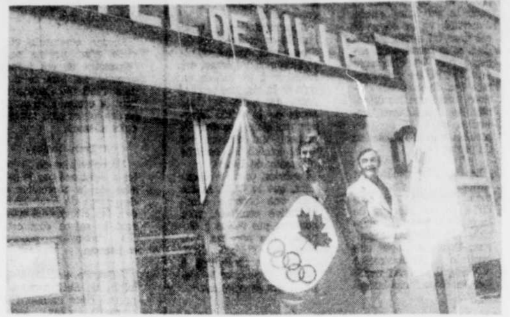
Depuis hier matin, les deux mats de l'hôtel de ville de Victoriaville arborent les drapeaux officiels des Jeux du Québec et de l'Association canadienne olympique afin de bien mettre en évidence que Victoriaville est la ville-hôte des Jeux régionaux du Centre du Québec. Ces drapeaux furent obtenus grâce à la col-

Il y aura également une catégorie pour les filles et on anticipait une participation massive.