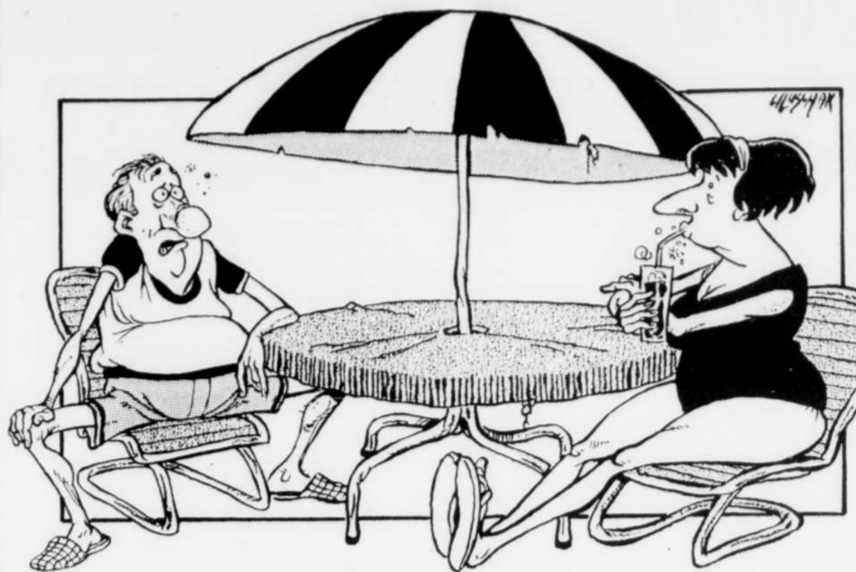
Très inquiétant cet accord constitutionnel! Comment une chose sur laquelle s'entendent tous les dirigeants du pays peut-elle être bonne pour le Canada?