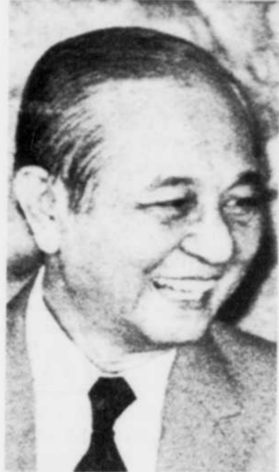
Le ministre Jaime Ferrer

M. Ernesto Maceda, un ancien collègue de M. Ferrer au gouvernement, a indiqué qu'il avait eu des informations, avant l'ouverture solennelle lundi dernier des travaux du Congrès nouvellement élu, selon lesquelles étaient projetés des assassinats de membres du gouvernement ou d'autres responsables politiques importants.