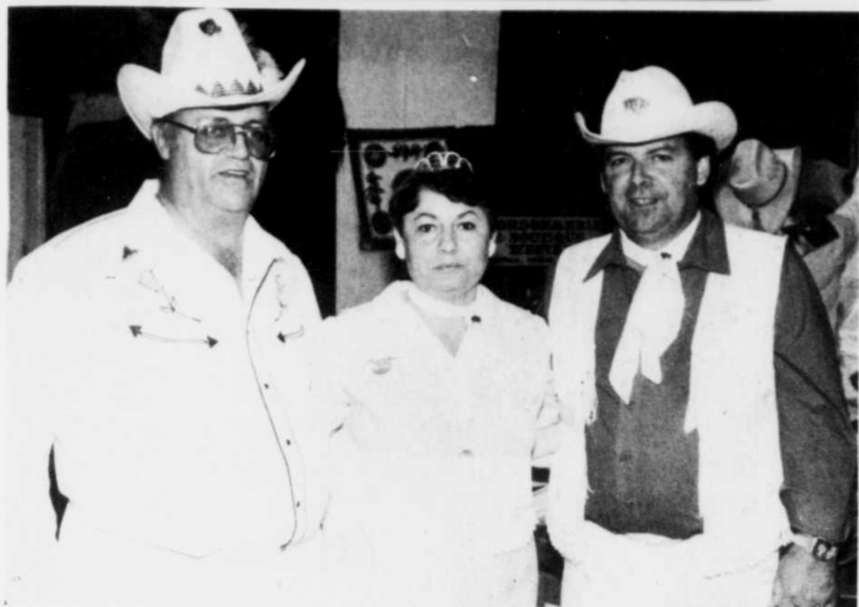
Le Festival du bison

Le Festival du bison d'Omerville a été à nouveau cette année un franc succès, aux dires des organisateurs. Sur la photo, dans l'ordre habituel, Vic Cl-