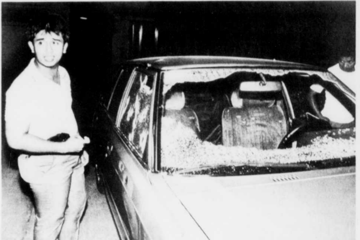
Un enquêteur explique comment les assaillants ont pu abattre le ministre et son chauffeur qui circulaient à bord de cette voiture.