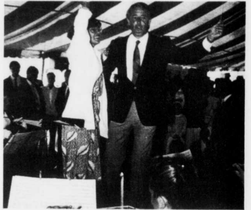
A St-Irénée, Brian Mulroney a été invité à diriger un orchestre pour le chant "When Irish eyes are smiling".

Des allusions sur une éventuelle candidature de M. Mulroney dans Charlevoix ont cependant été lancées tout au long de journée d'hier par les divers orateurs locaux.