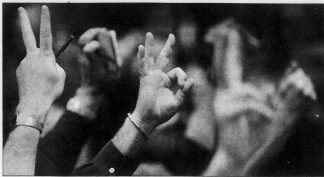
En fin de séance, le baril de brut de qualité light sweet crude pour livraison en janvier perdait 3,68 $US, à 45,45 $US, sur le New York Mercantile Exchange.

Des réserves inférieures à l'an dernier Toutefois, «les réserves de fioul restent inférieures de 10 Mb à leur niveau de l'an dernier» à la même période,