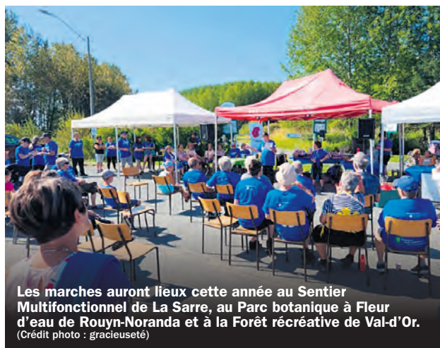
Les marches auront lieu cette année au Sentier Multifonctionnel de La Sarre, au Parc botanique à Fleur d'eau de Rouyn-Noranda et à la Forêt récréative de Val-d'Or.