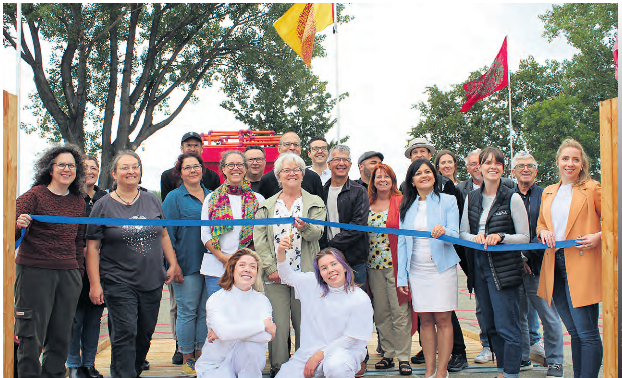
Partenaires, collaborateurs et amis ont procédé à la coupure du ruban.

L'expérience de la Machine à Parole ainsi que des Longues-vues est unique et ludique pour les visiteurs leur permettant ainsi d'apprécier encore plus leur passage sur les lieux.