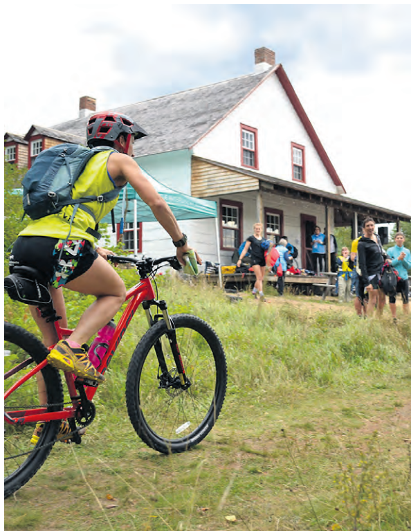
La première édition du Raid Témiscamingue s'était conclue au Parc national d'Opémican.