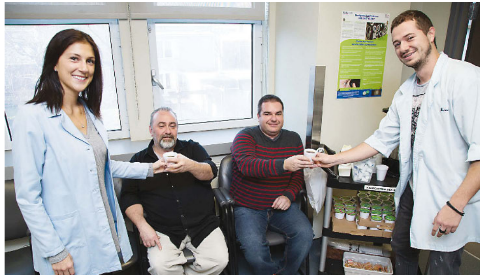
Deux bénévoles de la relève en compagnie de patients de l'HSS.

Plusieurs bénévoles se sont succédé depuis 1974, mais nous ne pouvons passer sous silence l'engagement, la générosité et la persévérance de l'une d'entre elles qui s'est investie avec autant de