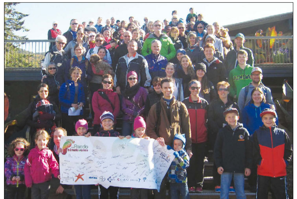
Les participants de la 3 e édition de la Rando hémato-onco lors de l'événement.