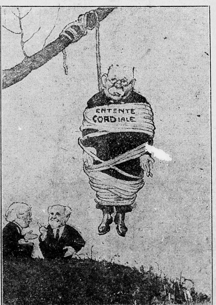
FRITZ.—Quel bonheur si cette corde se rompt, pour mettre fin à cette posture incertaine.