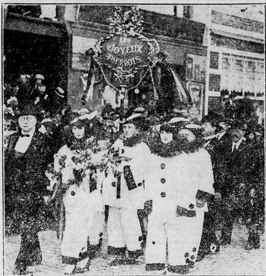
Un groupe de ceux qui faisaient partie récemment de la grande manifestation du dévouement à Ostende d'un monument aux héros alliés.