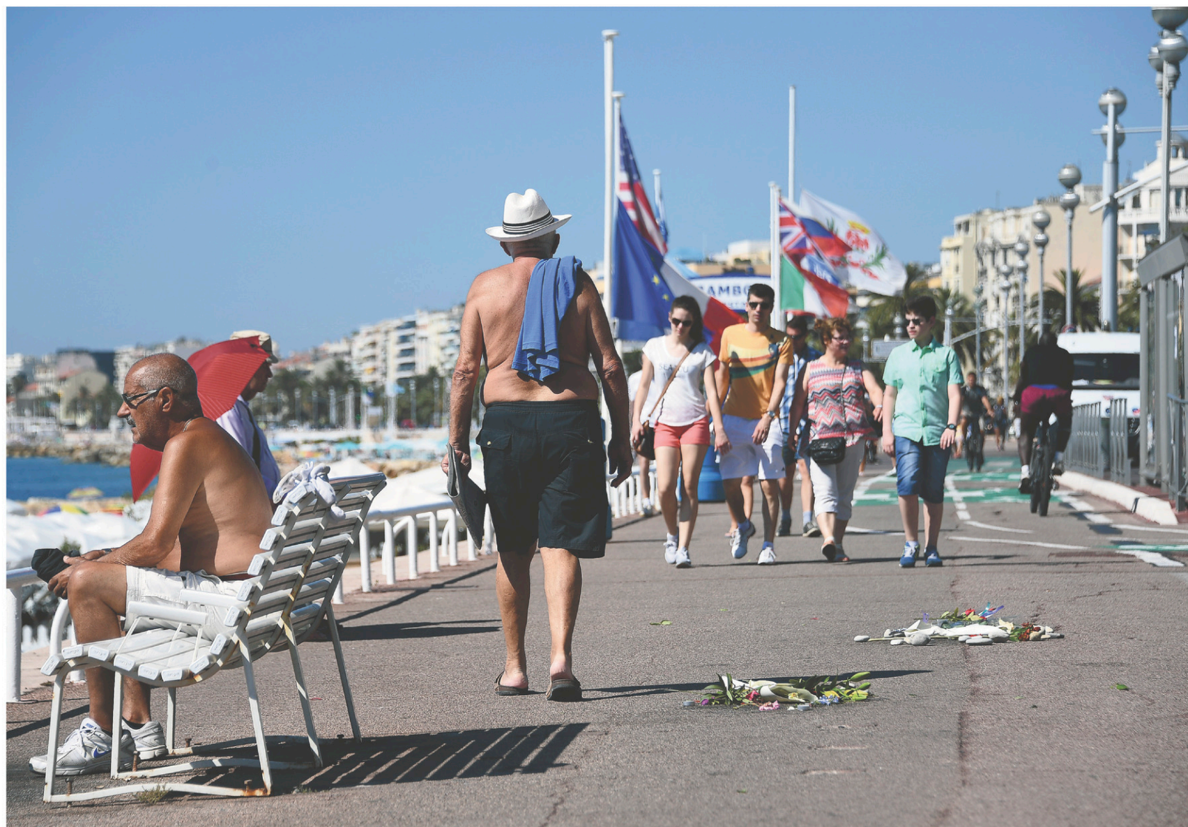
Sur la promenade des Anglais, des marcheurs circulent près des fleurs déposées au sol pour honorer la mémoire des victimes de l'attentat.

Lire aussi • Le camion de Nice. Une chronique de Jean-Claude Leclerc. Page B 6