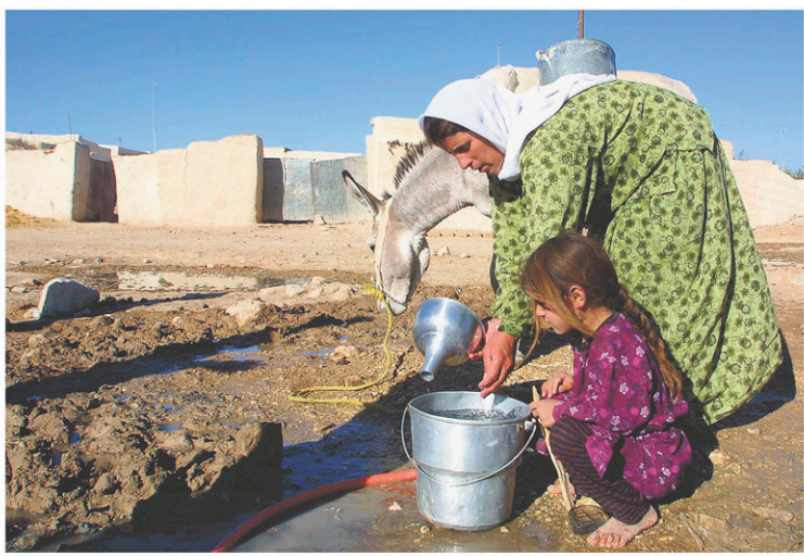
AHMAD AL-RUBAYE AGENCE FRANCE-PRESSE

Le sort des Yézidis, une minorité ethnique kurde, préoccupe la députée conservatrice Michelle Rempel.