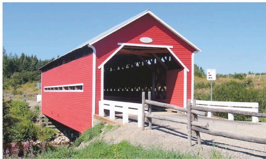
Le Québec a compté environ 1000 ponts couverts au fil de son histoire. Parmi eux, il y a le pont Louis-Gravel de Sacré-Cœur (en haut à gauche), le pont Émile-Lapointe de Pointe-aux-Outardes (en haut à droite), le pont des Draveurs de Rimouski (en bas à gauche) et le pont Rouge de Sainte-Jeanne-d'Arc (en bas à droite).