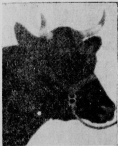
"BELLE DU LAC-3H - 12638" Prop: RR. SS. Ursulines - Roberval, P.Q.