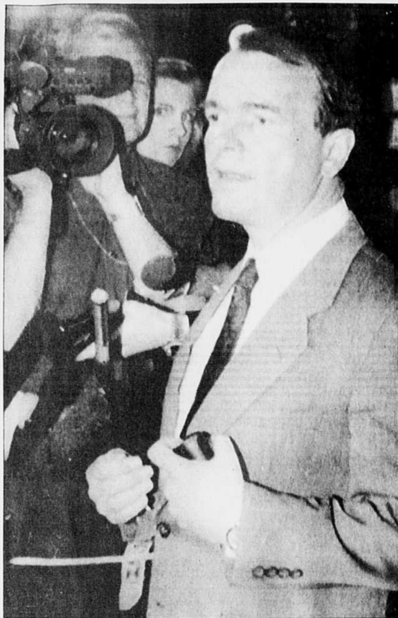
Le leader du gouvernement au Sénat Lowell Murray s'est montré fort satisfait de l'adoption du projet de loi sur la TPS. Il a affirmé que le gouvernement n'avait pas eu d'autre choix que d'agir comme il l'a fait.

Le projet de loi doit encore obtenir la sanction royale, mais ce n'est plus qu'une formalité.