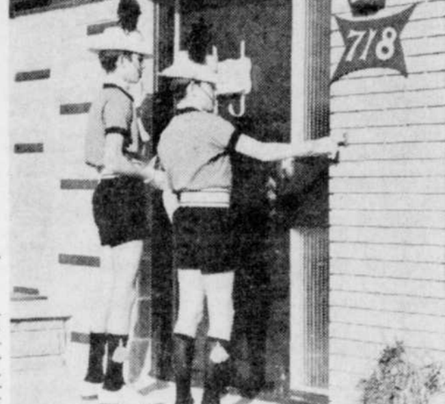
SOUSCRIPTION POPULAIRE — La souscription populaire des Cadets de Thetford Mines aura lieu du 29 septembre au 3 octobre. Les Cadets visiteront tous les foyers et l'objectif a été fixé à $1 par famille. La scène que nous voyons ci-dessus se répétera très souvent durant cette période.

Deux autres élèves de la Commission scolaire de St-Jean-de-Brébeuf ont été acceptées dans les classes spéciales à l'école Curé d'Auteuil pour l'année scolaire 1969-70.