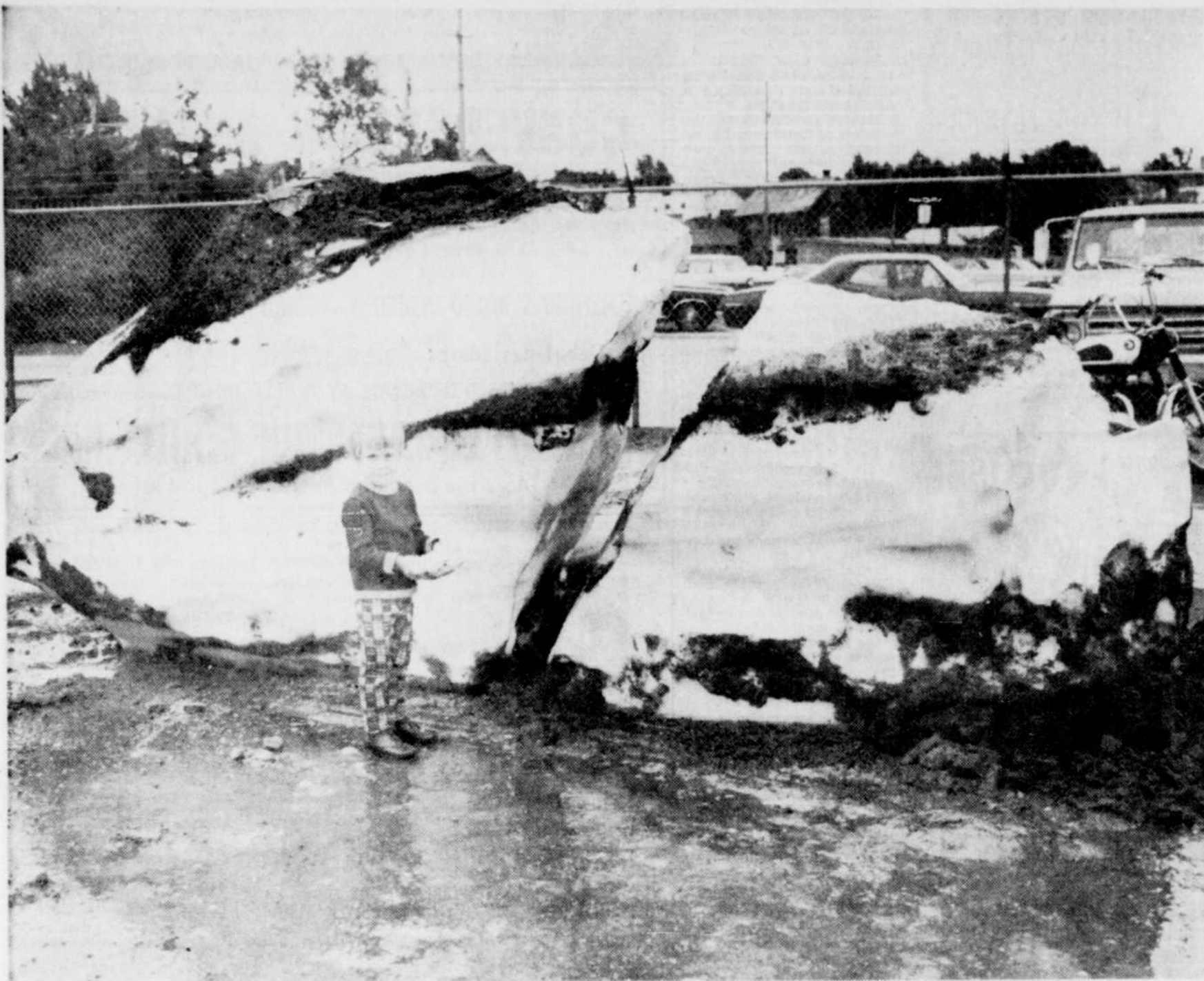
"Puis-je l'emporter à la maison" semble dire la petite Danièle trois ans tenant un petit morceau de neige. Le "gros" morceau de neige a en effet été trouvé à Asbestos sous une montagne d'amiante et daterait de 1925. La jeune fillette peut se consoler car elle aura l'occasion de jouer dans de la neige "neuve".