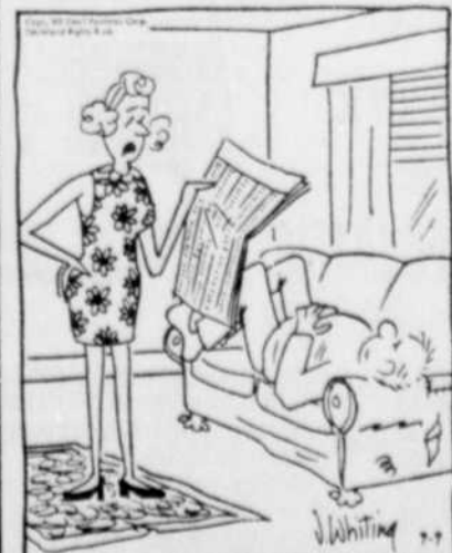
"Chéri, si tu continues à te coucher de cette façon sur le divan, il serait bon de jeter un coup d'oeil en vue d'en acheter un autre". (Annonces classées pages 19-20-21).