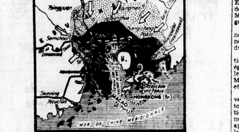
La situation autour de Canton (début de décembre 1938). Surfaces noires: territoires occupés par les Japonais au début de décembre 1938; surfaces pointillées: territoires conquis par les Chinois depuis le début de novembre 1938. Les flèches indiquent la direction de la contre-offensive chinoise.