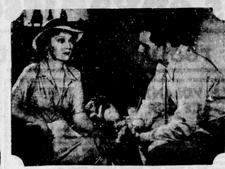
Pierre Richard Willm - Edwige Feuilleire dans 'LA DAME DE MALACCA'...

6 heures: CKCO - Orchestre, CKCH - Orchestre de danse, CKAC - Nouvelles, 6.05 - Orgue, 6 heures 15: CBO - Informations, CBO - Le crépuscule, CKAC - Sérénaade tzigane, 6 heures 30: CBO - Howie Wing, CKAC - Chansonnettes, CKCF - Radio Journal, 6 heures 45: WJZ - Lowell Thomas, commentateur d'actualité, CKAC - Nouvelles, CKCF - Chansonnettes, 7 heures: CKCO - Concert, CKAC - Radio-reportage, CKCF - Sketch, CKCF - Méloides du soir, 7 heures 15: CKCO - Concert, WEAF - Amos n'And' Sketch, CKAC - Le club sportif, CKCF - La pension Velder, 7 heures 30: CBO - Variétés, CKCF - Robin des bois, CKAC - Variétés, 7 heures 45: CBO - Chant et orchestre, CKCF - Chant et orchestre, CKCO - L'été dramatique, CKAC - Tridium de Lourdes, 7 heures 55: CKAC - Pianiste, CBO - Causette, CKCF - A choisir, CKCF - Causette, CKCO - Town erier, 8 heures: CKCO - Ramlers, CKCO - Orchestre symphonique, WEAF - Rudy Vallée, CKCF - Ensemble instrumental, WABC - Kate Smith, CKCF - Orchestre "mp" mius, 8 heures 30: CKCO - A choisir, CKAC - Ensemble mélodique, CKCF - Orchestre, CKCF - Orchestre symphonique, 9 heures: CKCH - Orchestre, CKCO - Old favourites, WEAF - Good News of 1938, CBO - Good News of 1938.