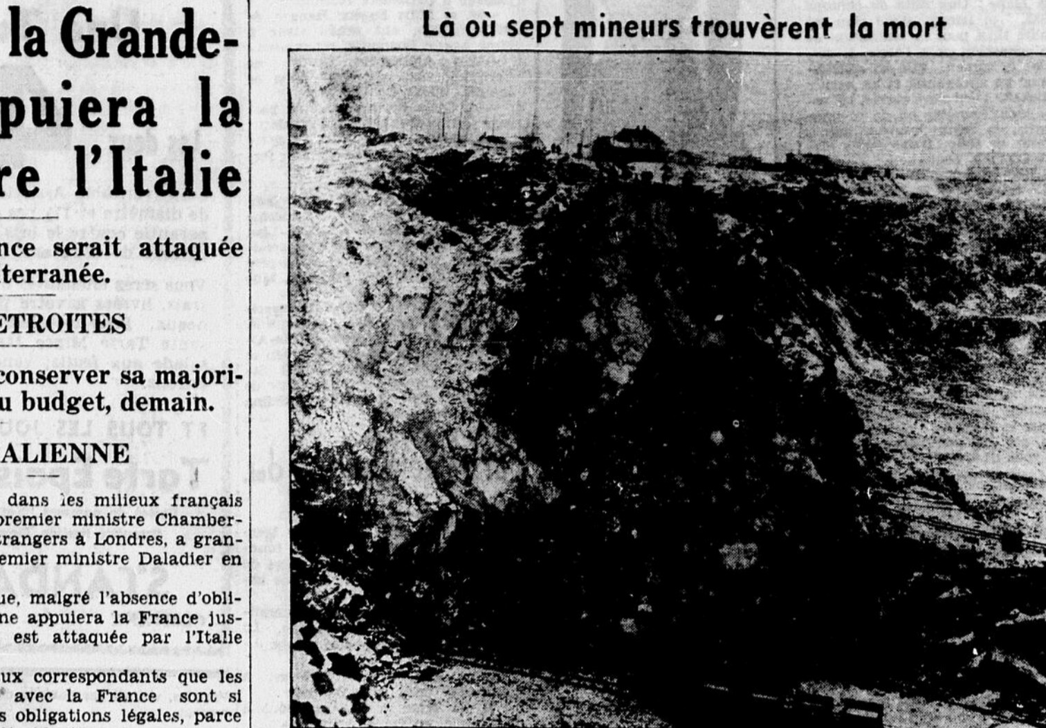
Là où sept mineurs trouvèrent la mort. Une vue sinistre de l'effondrement de Thorford Mines. Au sommet du cliché, on voit des parents éplorés de sept malheureux broyés qui gisent sous l'amoncellement de rocs et de glaise. Au premier plan, au centre, les centaines de tonnes de roc qui se sont effondrées soudainement sur les mineurs, incapables de remuer.

AUX ELECTIONS DU 8 NOVEMBRE DERNIER AUX E.-UNIS. (Presse associée) WASHINGTON, 14. — Une compilation nationale montre que les démocrates ont recueilli 49 pour cent des votes accordés aux membres de la chambre des représentants, lors des élections du 8 novembre aux Etats-Unis. Les républicains en ont obtenu 47,8 pour cent et les partis secondaires 3,2 pour cent. Aux élections présidentielles de 1936, les démocrates obtinrent 60,2 pour cent des voix, et aux élections à la chambre des représentants, en 1934, ils en recueillirent 53,4 pour cent.