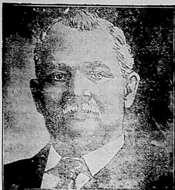
Sydney Mines, N. E., 25 janvier 1910.

Pensait qu'il avait un Cancer à l'Estomac "FRUIT-A-TIVES" l'a Guéri