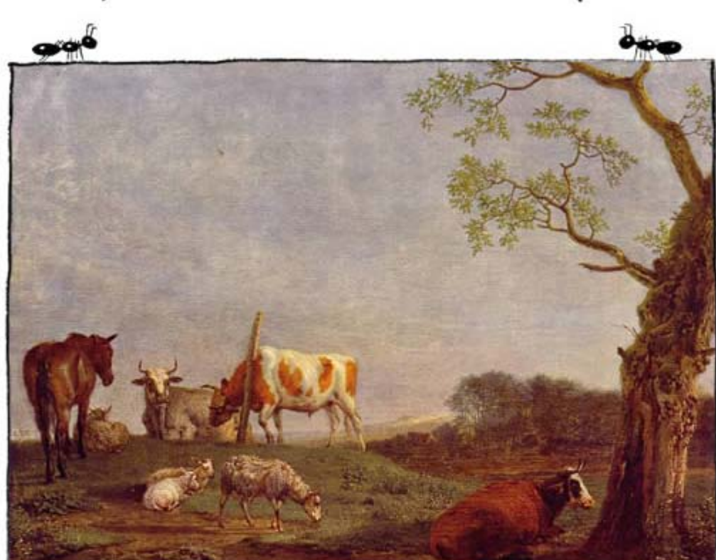
Paulus Potter - Le troupeau paisible, 1652, Huile sur toile 35,5 x 46,5 cm

Voilà au moins un courant artistique qui tient compte du fait qu'il n'y a pas que des humains sur terre!