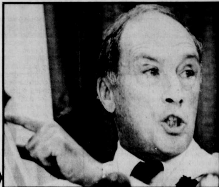
Armé de graphiques et de tableaux, le premier ministre Trudeau tentait de justifier l'entente intervenue avec l'Alberta lors d'une conférence de presse tenue à Ottawa.

Il a par la suite indiqué que même s'ils ne constituent que des approximations, les prix qu'auront à payer les Canadiens pour leur essence d'ici