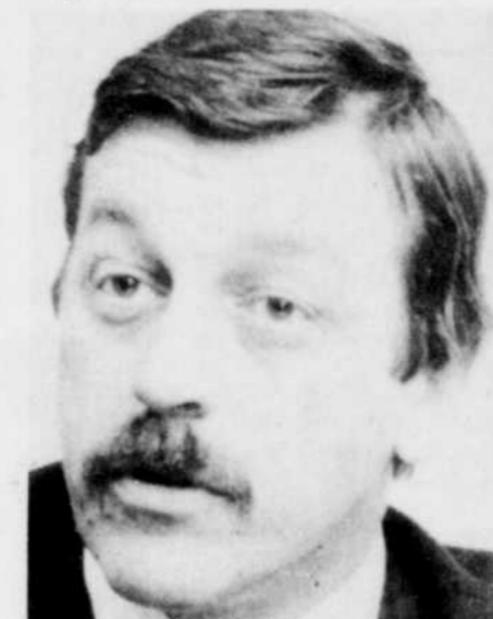
Le ministre des Affaires culturelles, Clément Richard

développement d'un cinéma fort et internationalement compétitif, les subventions de l'Etat se font encore plus sélectives que dans le passé. Dès lors tandis que certains affichent un optimisme artificiel pour l'avenir, les autres rongent leur frein, abandonnant ou investissent jusqu'à l'indécence, croyant peut-être que la créativité surgira de cette foire aux cancre.