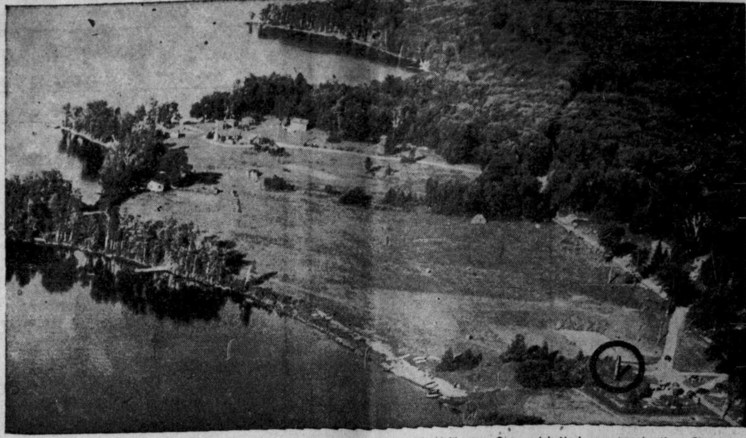
Ce que l'on aperçoit dans le cercle noir est la cheminée de l'hôtel de villégiature de Haliburton, Ont., qui brûla la semaine dernière. Cette cheminée est tout ce qui reste de la bâtisse. Les dégâts ont été évalués à $10,000. Cet hôtel était magnifiquement situé sur les bords du lac Kawawitogamog.