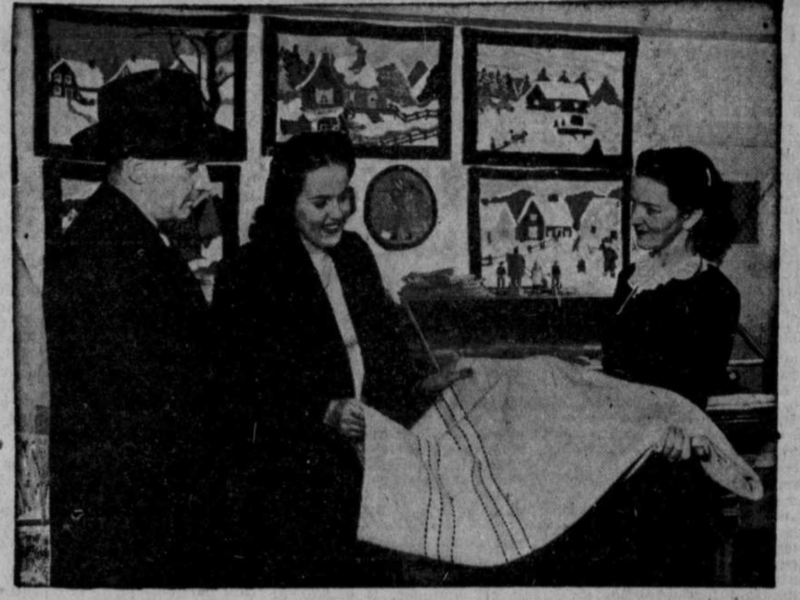
A Lennoxville, les touristes trouvent un comptoir où ils peuvent se procurer un grand nombre d'articles fabriqués dans la région. La scène que représente cette vignette est, toutefois, répétée dans plus d'un village ou d'un centre urbain québécois; car l'achat des catalogues, des tapis crochétés, etc., etc., constitue, pour le voyageur, un geste devenu presque rituel.