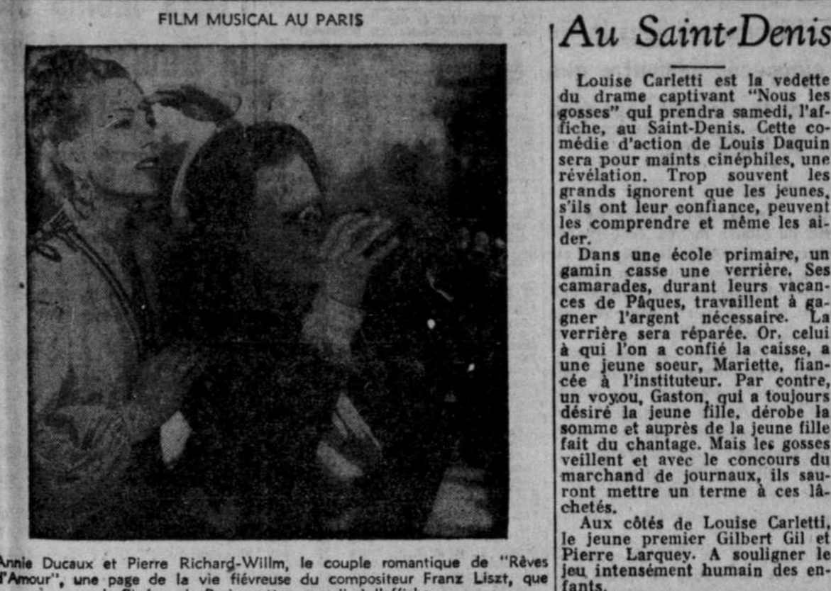
Annie Ducaux et Pierre Richard-Willm, le couple romantique de "Rêves d'Amour", une page de la vie fiévreuse du compositeur Franz Liszt, que le Cinéma de Paris mettra samedi, à l'affiche.

Le nouvel émetteur que la Société Radio-Canada inaugure officiellement le jeudi 26 août à Chicoutimi. Il permet au poste CBJ de rayonner sur un vaste territoire urbain et rural d'environ 200,000 personnes. La puissance du nouvel émetteur est officiellement de 10,000 watts, mais sa puissance réelle dépassera 22,000 watts grâce à l'ingénieuse disposition de l'antenne située à 5 miles à l'ouest de Chicoutimi.