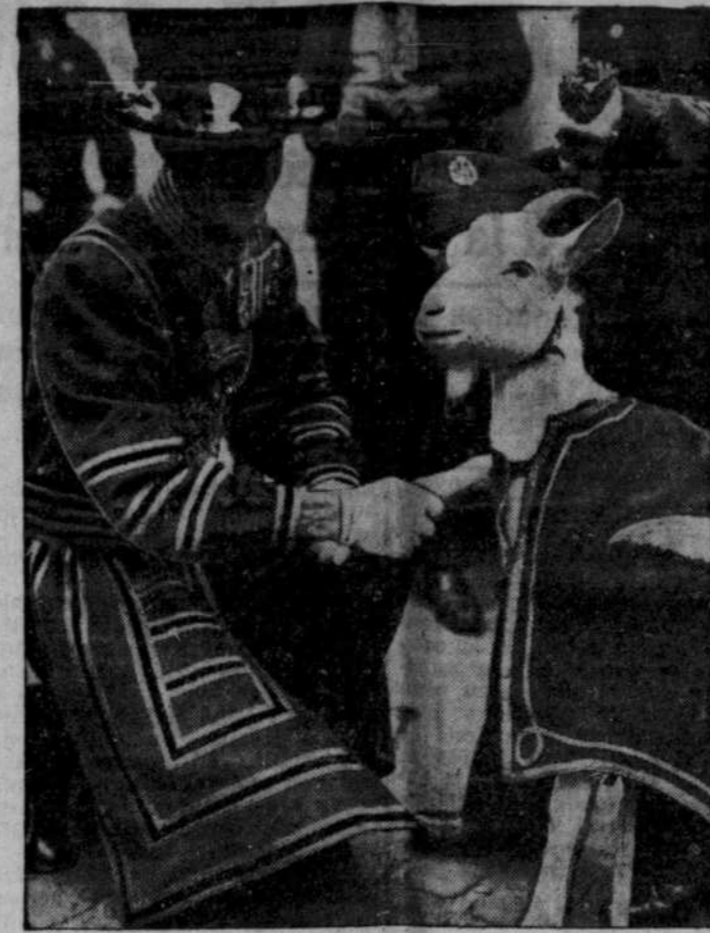
Lewis II, chèvre parfumée pour la circonstance et d'une blancheur immaculée, se prête de bonne grâce au rôle important qu'elle est appelée à jouer. Cet animal à cornes ne servira pas cette fois à une initiation de Chevaliers de Colomb mais il contribuera de sa personnalité à une campagne de secours pour les animaux qui ont servi dans l'armée britannique au cours de la dernière guerre. La chèvre porte fièrement la "chalcupe" militaire à l'angle réglementaire, alors qu'un garde lui souhaite la bienvenue à la Tour de Londres.

Dawson se souviendra longtemps de ces fêtes inoubliables, profitant en ardeur de gloire sur les deux mérites congrégations des Pères Oblats de Marie-Immaculée et des Soeurs de Ste-Anne, depuis cinquante ans au service des mineurs de toute race et de toute religion au pays du Yukon, le Pays du Soleil de Minuit.