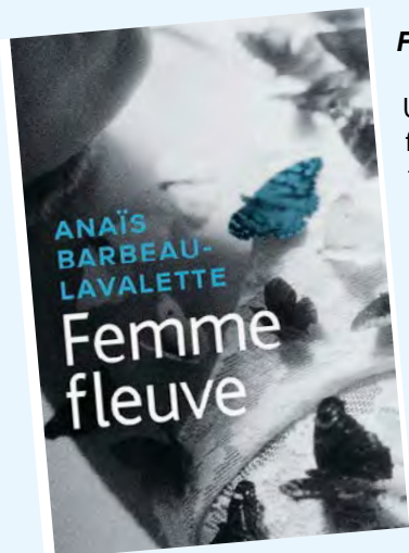
Femme fleuve / Anaïs Barbeau-Lavalette