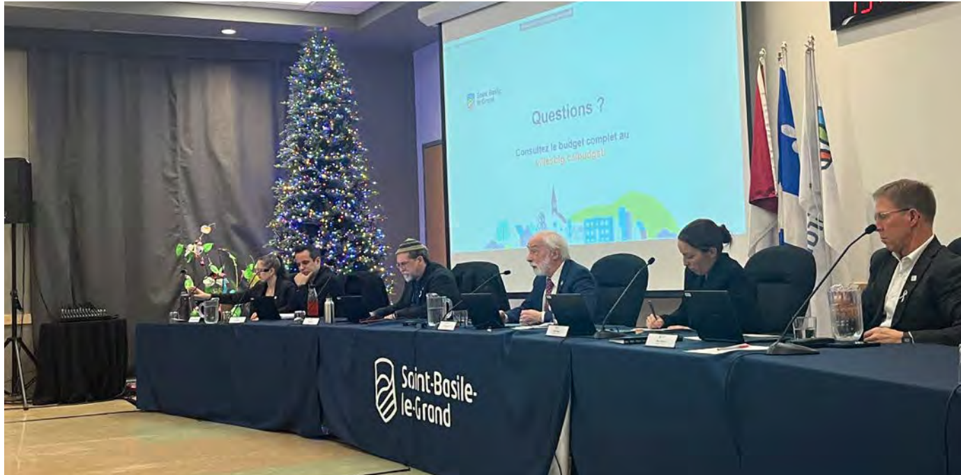
Le conseil municipal a changé le mode de diffusion des avis publics.

À Saint-Basile-le-Grand, le conseil municipal a adopté, en décembre, une résolution afin de modifier le mode de diffusion des avis publics de la Ville. Le règlement est entré en vigueur le 13 décembre.