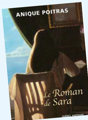
Le roman de Sara / Anique Poitras

Anaïs aurait dû écouter Édén et s'enfuir. Mais quand on finit par trouver l'amour, le vrai – celui que tous traquent de bar en bar, celui dont on rêve au fond d'un lit froid –, il devient difficile d'y renoncer au nom d'un sombre présage d'avenir. Édén devient lentement prisonnier de son corps, et Anaïs de cet amour plus grand que nature qu'elle ne sait réprimer. Que faire d'autre alors que prendre son souffle et plonger? Les pires choix sont parfois ceux que l'on fait par amour. Disponible aussi en format numérique sur pretnumerique.ca .