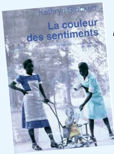
La couleur des sentiments / Kathryn Stockett

EN CE MOIS DE L'AMOUR, LA BIBLIOTHÈQUE ROLAND-LEBLANC SOUHAITAIT VOUS FAIRE DÉCOUVRIR DES LECTURES INCONTOURNABLES AUX YEUX DE NOTRE ÉQUIPE. IL Y A DES LIVRES DE TOUS LES GENRES. AMUSEZ-VOUS À LES DÉCOUVRIR ET PARTAGEZ VOS IMPRESSIONS AVEC NOUS À LA BIBLIOTHÈQUE.