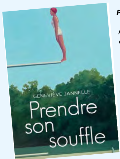
Prendre son souffle / Geneviève Jannelle

Steph est victime d'une tentative de viol et de meurtre au cœur de la nuit. Une question brûle. Toé, qui es-tu? Steph t'a combattu et t'a résisté. Tu as perdu à la mort, elle a gagné à la vie. Quête profonde de justice, hommage à ce qui pousse vers la lumière, ce roman explore les rouages d'une enquête et la trajectoire d'une victime face au système judiciaire. Puisant dans sa propre expérience, Geneviève Rioux écrit cette fiction comme on suture des plaies pour les guérir. Le souffle retrouvé, puis retenu jusqu'à la dernière ligne, une question reste toutefois, comme une exclamation : qui meurt au moment de tuer?