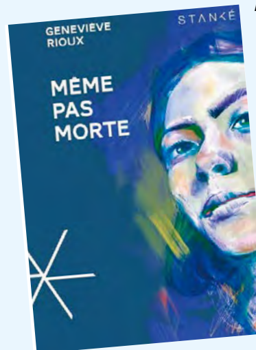
Même pas morte / Geneviève Rioux

Un peintre se retrouve sur la grève d'un grand fleuve afin d'en reproduire le bleu quand une femme vient bouleverser sa vie. Comme deux amoureux qui se sont rencontrés trop tard, ils se réfugient l'un dans l'autre. Vœu lumineux d'une beauté sauvage, ce nouveau roman d'Anaïs Barbeau-Lavalette porte sur ses ailes la résilience des huîtres qui fabriquent une perle de leur blessure, la majestuosité du lis géant qui ne fleurit que tous les sept ans et l'audace de toutes les femmes qui ont décidé d'écrire leur désir.