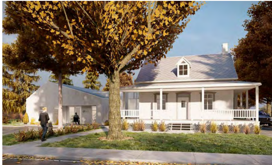
Les travaux d'agrandissement de la Maison de répit l'Intermède devraient débuter sous peu.

Les travaux devraient permettre de répondre aux besoins d'environ 125 familles. Présentement, la Maison de répit l'Intermède offre ses services pour une soixantaine de familles venant de Saint-Basile, de Belœil, de Saint-Hilaire et d'autres villes de la Montérégie.