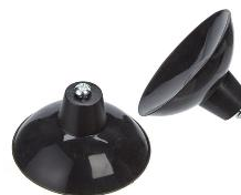
Ancrages « ventouses »

Hauteur d'environ 5 cm Profondeur de vis de +/- 1,5 cm