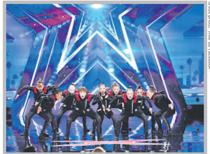
La troupe Youngster a épaté le jury lors de sa prestation à America's Got Talent.

Tous les juges d' America's Got Talent ont donné leur accord pour que le groupe passe à la prochaine étape du concours.