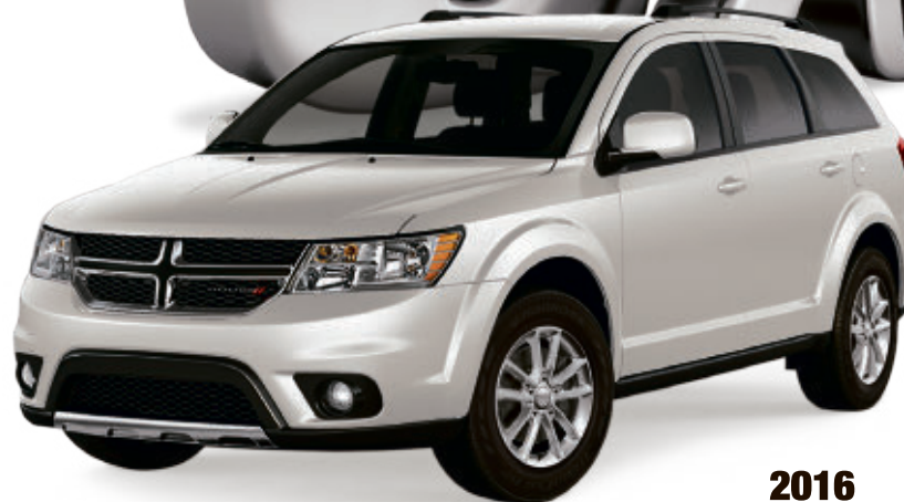
2016 DODGE JOURNEY SE

À PARTIR DE 26 995$ 1 OU LOUEZ À 299$ 2 PAR MOIS POUR 60 MOIS