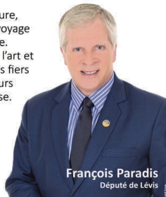
François Paradis Député de Lévis