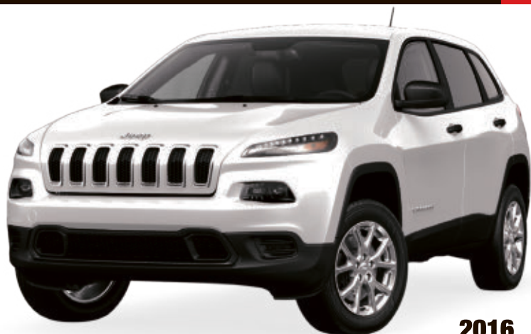
2016 JEEP CHEROKEE SPORT 4X2

À PARTIR DE 26 995$ 1 OU LOUEZ À 299$ 2 PAR MOIS POUR 60 MOIS