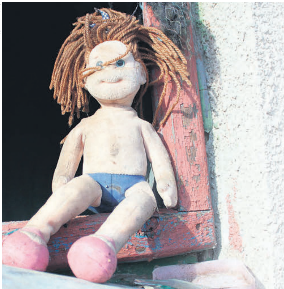
➤ Près du quart des 1 973 signalements qui ont été faits sont liés à des cas de négligence.