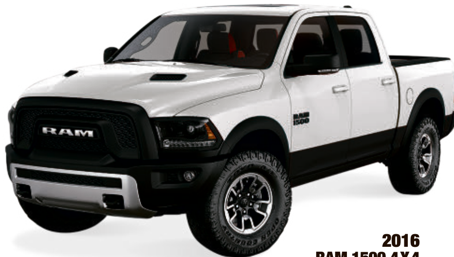
2016 RAM 1500 4X4

À PARTIR DE 23 695$ 5 ACHETEZ À 124$ 6 PAR 2 SEM POUR 96 MOIS