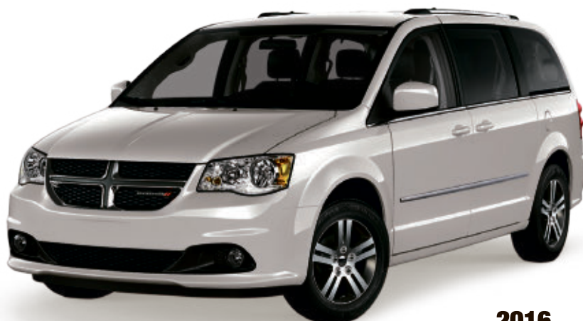
2016 DODGE GRAND CARAVAN SE

À PARTIR DE 22 095$ 3 OU LOUEZ À 289$ 4 PAR MOIS POUR 48 MOIS