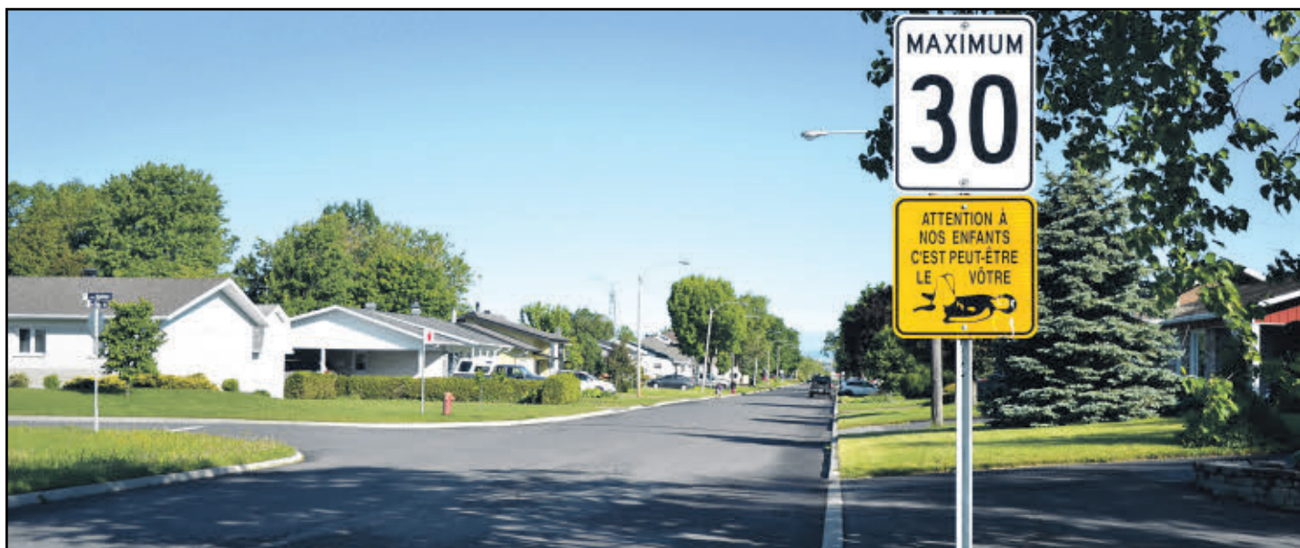
► Selon les résidents de la rue Kennebec, la limite de vitesse de 30 km/h n'est pas toujours respectée sur cette artère.

Deux ans plus tard, la limite de 30 km/h n'est toujours pas respectée sur l'artère, déplore la citoyenne. Elle avance que certains autobus de la STLévis roulent à une vitesse de plus de 50 km/h.