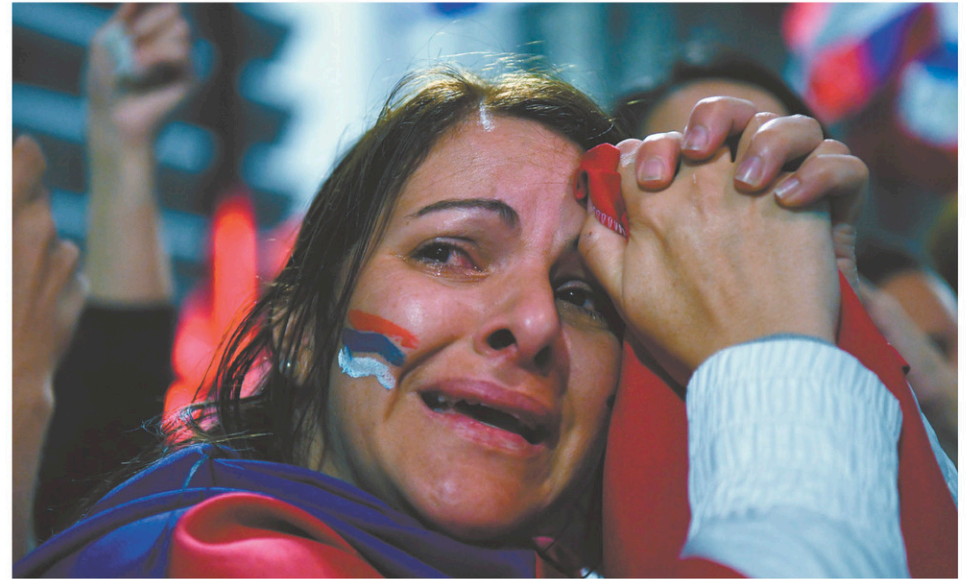
Les partisans du Frente Amplio attendaient les résultats officiels avec inquiétude.

En temps normal, l'accès à Internet est largement filtré ou restreint par les autorités : à l'exception d'Instagram et WhatsApp, les grands réseaux sociaux internationaux comme Facebook, Twitter ou Telegram ne sont accessibles qu'en utilisant un « réseau privé virtuel » (VPN).