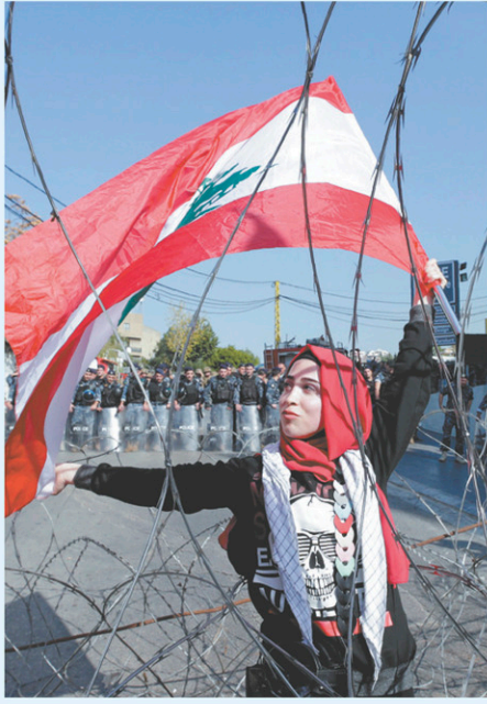
Des manifestants se sont réunis devant l'ambassade américaine dimanche.