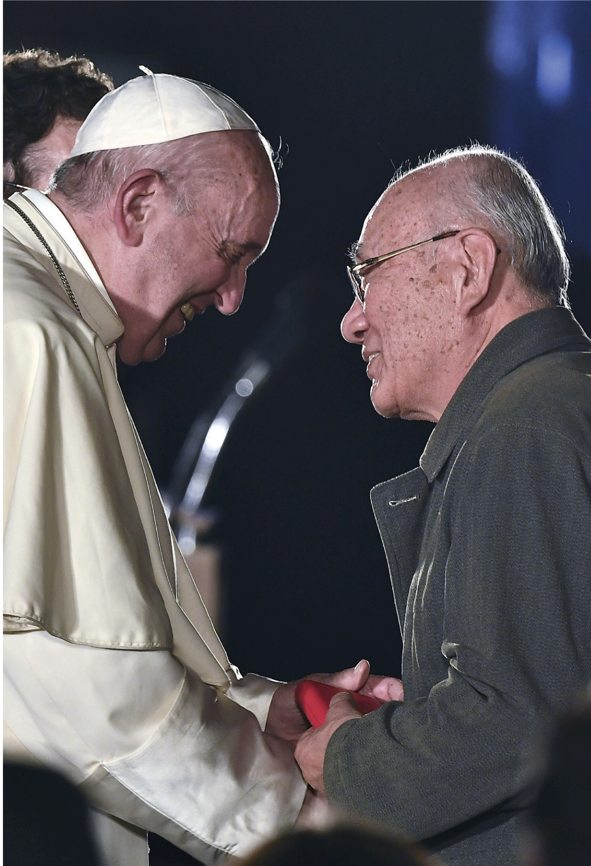
Le pape François a rencontré dimanche des survivants du bombardement atomique d'août 1945.

Le pape s'est aussi insurgé dimanche contre toute la filière de l'armement : « La fabrication, la modernisation, l'entretien et la vente d'armes toujours plus destructrices sont un outrage continu qui crie vers le ciel. »