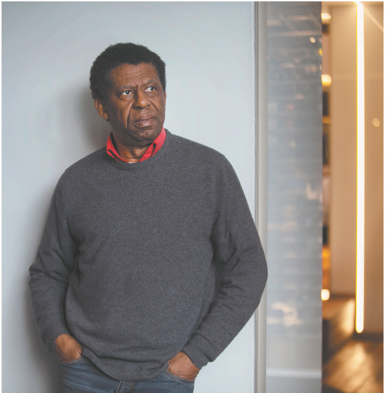
En une série de vignettes où l'on retrouve son habituel sens de la formule, Dany Laferrière a composé cette fois un livre en trois temps : l'enfance en Haïti et la nourriture, les peintres primitifs et les poètes haïtiens.

Dans la continuité de son Autoportrait de Paris avec chat (Grasset, 2018), il revient aujourd'hui avec un second livre dessiné (où il n'y a que le code-barre qui ne soit pas entièrement tracé à la main). Grasset n'ayant, semble-t-il, pas souhaité répéter l'expérience,