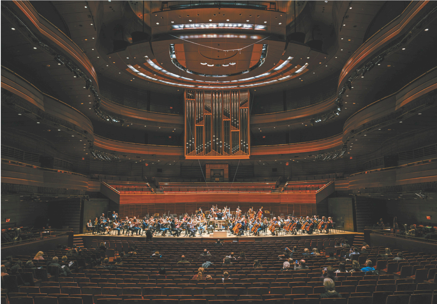
Alors que Carnegie Hall porte généreusement le son, le Verizon Hall de Philadelphie est très instantanément réactif aux variations de nuances. Yannick Nézet-Séguin y sensibilise d'emblée ses musiciens. Et ce sont ces moments de subtilités et les contrastes dynamiques qu'il va creuser pendant le concert.