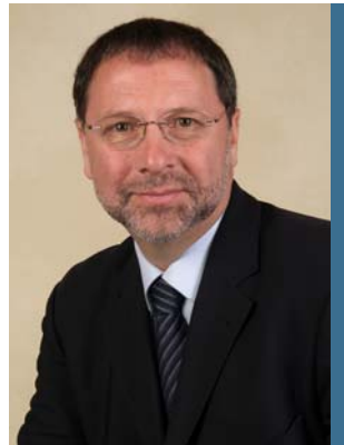
Yves-Thomas Dorval, président du Conseil du patronat du Québec

Face à la politique de l'irresponsabilité proposée par l'Alliance sociale, les employeurs proposent plutôt au gouvernement l'instauration d'un cran d'arrêt qui interdirait légalement la création de toutes dépenses de programmes additionnelles qui ne seraient pas compensées par des compressions dans les dépenses de programmes existants.