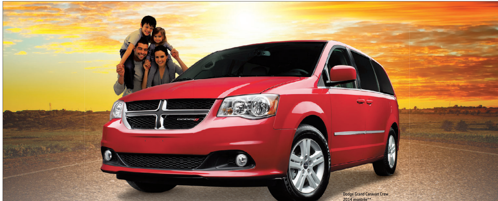
Dodge Grand Caravan Crew 2014 montrée**