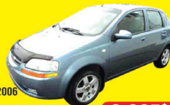
Chevrolet Aveo 5 LS 2006 78 000 km (Stock# 13130A)