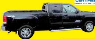
GMC SIERRA 1500 4WD EXTENDED CAB 2009 123 500 km (Stock# 13129A)