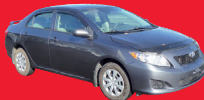
TOYOTA COROLLA 2010, automatique, air climatisé, 75 327 km. #ACC1406