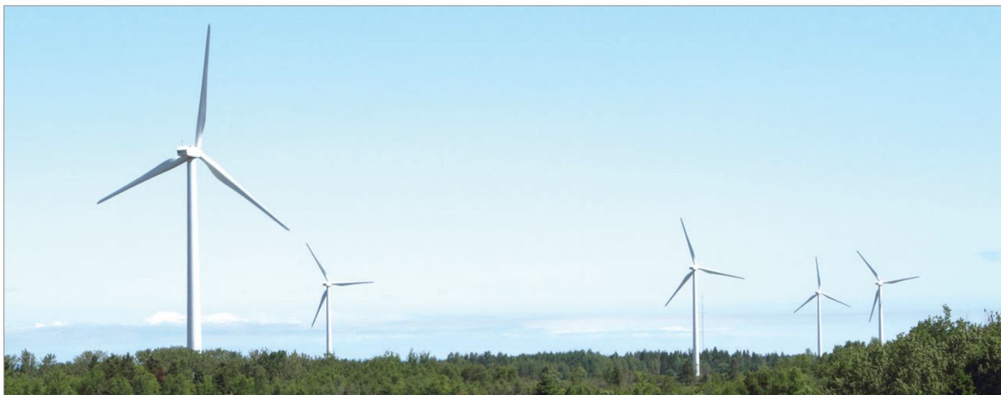
Le congrès annuel de l'association de l'énergie éolienne est le plus grand événement du secteur éolien au Canada, avec plus de 1 500 participants.