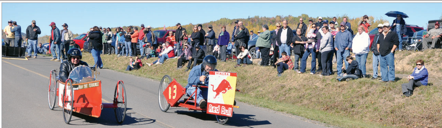
Cinquante boîtes à savon ont dévalé la pente de la route Gallagher au cours du Festival d'automne.

Entre 60 et 70 bénévoles œuvrent à la tenue du Festival. Cet événement, qui croît à chaque année, a reçu quelque 3 500 visites cette année aux différentes