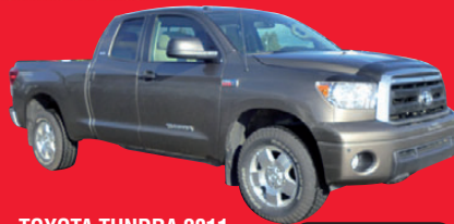
TOYOTA TUNDRA 2011, double cab TRD, 4X4, 5.7L. 52 055 km. #140022A