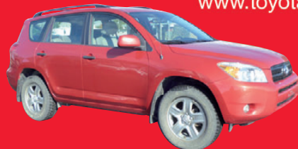
TOYOTA RAV4 2008, tout équipée, 132 044 km. automatique #130148A