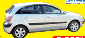
Kia Rio5 EX 2008 58 873 km (Stock# 13261A)