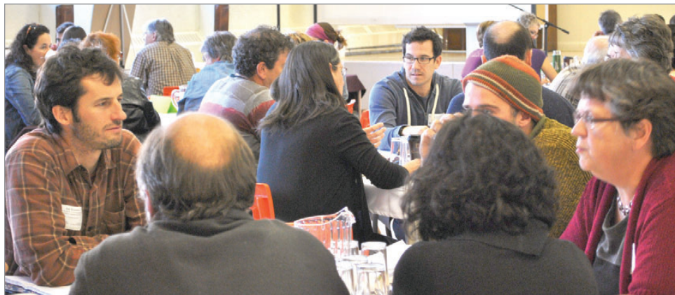
Plus de 60 personnes ont participé au forum sur la lutte à la pauvreté et à l'exclusion sociale.

Depuis 2012, la MRC d'Avignon a mandaté le CLD d'Avignon pour mettre en place l'approche territoriale intégrée (ATI). L'ATI est une démarche qui rassemble une vingtaine de partenaires de différents horizons dans le but de produire et de mettre en œuvre un plan d'action de lutte à la pauvreté et à l'exclusion sociale. En procédant à ce vaste exercice de consultation, le comité s'assure que le plan