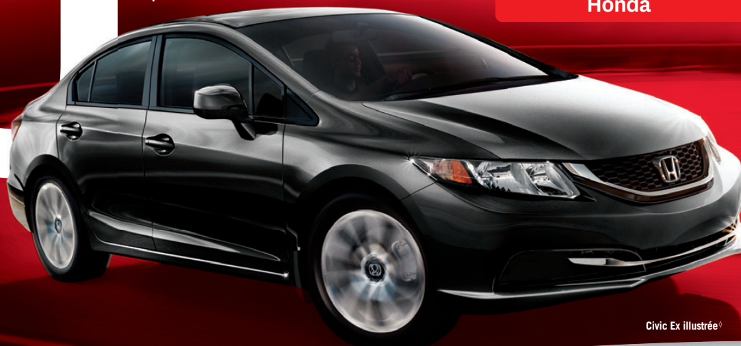
Civic Ex illustrée 1