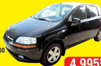
Chevrolet Aveo 5 LS 2008 94 757 km (Stock# 12261A)