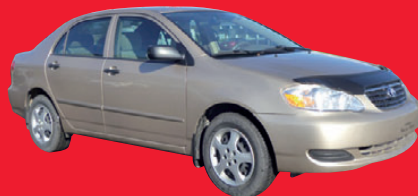
TOYOTA COROLLA 2008, automatique, air climatisé et régulateur de vitesse, 108 253 km. #ACC1375