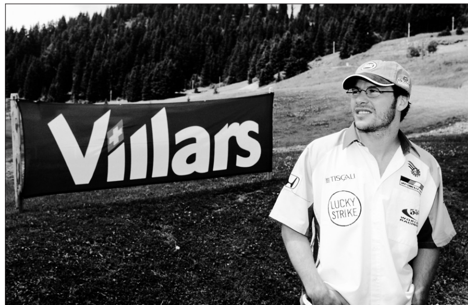
La F1 derrière lui et la vie devant lui, Jacques Villeneuve entend faire tout ce qu'il faisait avant, dont le ski alpin, mais de façon plus intense.