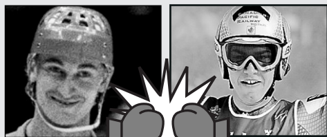
* Champion * WAYNE GRETZKY

Cette semaine, Wayne Gretzky affronte Érik Guay . Vous pouvez voter pour votre favori à sports@lapresse.ca ou à www.cyberpresse.ca/sports Le gagnant sera dévoilé samedi prochain.