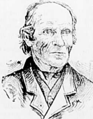
LE PÈRE MALO, Beau-père de l'accusé.

Vers neuf heures, le juge Lorimer prit possession de son banc et les jurés firent leur entrée tandis