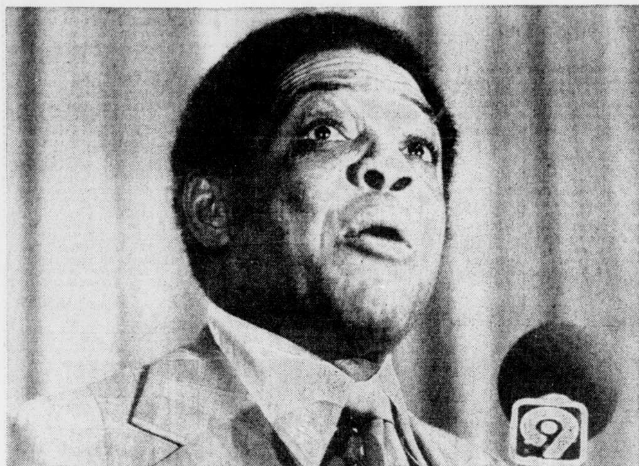
Willie Mays qui se considère comme le meilleur joueur de baseball qu'il ait vu à l'oeuvre, a été élu au temple de la renommée du baseball, hier.