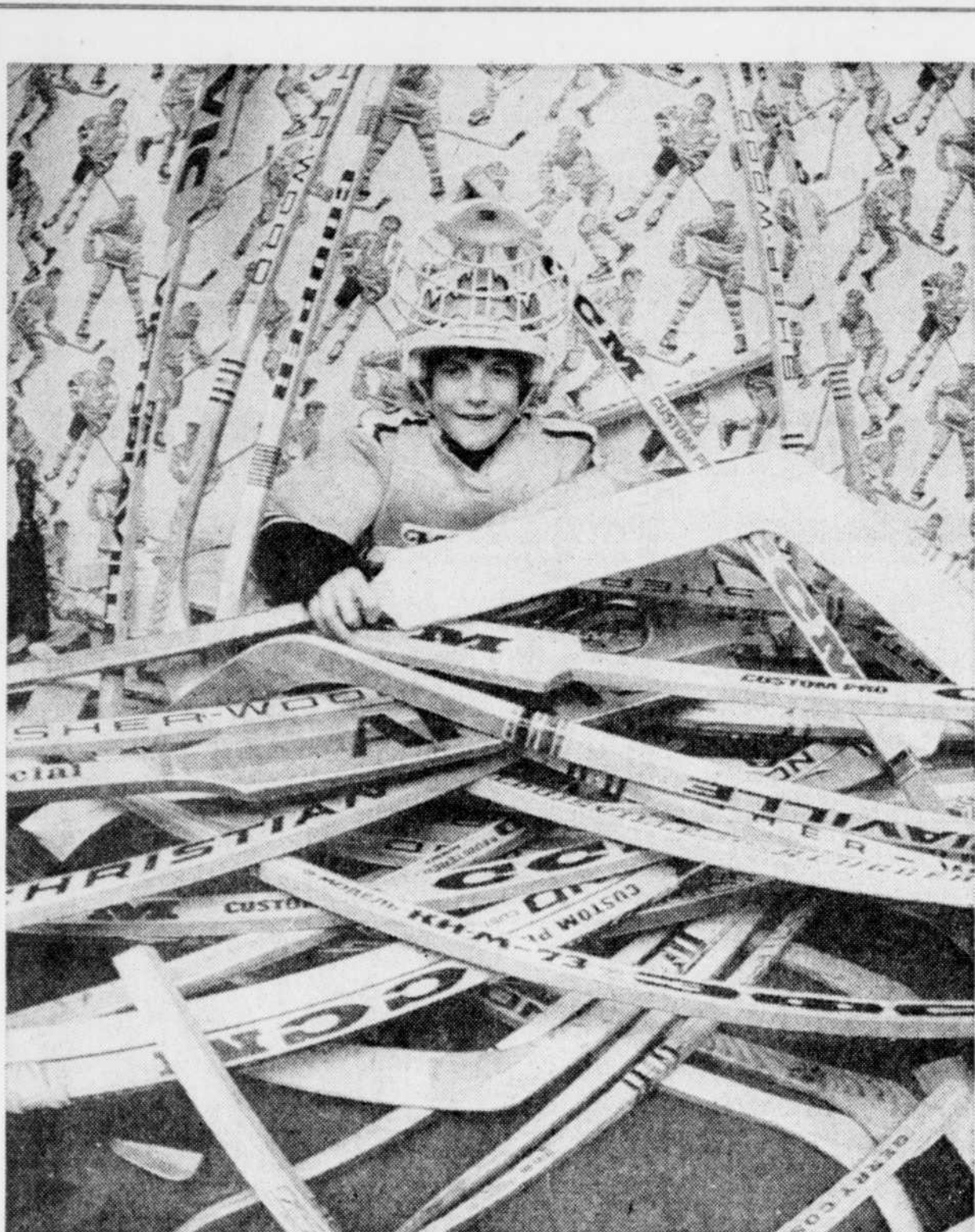
Une collection encombrante

Première période 1-Québec, Tremblay, 4e (Brackenbury) 0-44 2-Birmingham, Vaive, 15e (Goulet, Dillon) 2-16 3-Québec, Bernier, 21e (Tardif, Tremblay) 4-04 4-Québec, Côté, 7e (Leduc) 7-00 5-Québec, Tardif, 27e (Geoffrion, Lacombe) 17-35 Pénalités: Dillon Bir 2:23, Côté Qué 4:33, Weir Qué 14:41. Deuxième période 6-Québec, Geoffrion, 11e (Leduc) 3-24 7-Birmingham, Adduono, 11e (Turkiewicz) 12-36 Pénalités: Tardif Qué 0:32, Birmingham 15:50. Troisième période 8-Québec, Bernier, 22e (Lacombe, Cloutier) 2-35 9-Birmingham, Gingras, 11e (Ramage, Adduono) 4-34 10-Birmingham, Dillon, 7e (Tebbutt, Vaive) 14-31 11-Québec, Cloutier, 40e, 16-44 12-Birmingham, Goulet, 15e (Dillon) 19-31 Pénalités: Sleigher Bir, Weir Qué (majeures) 5:23, Vaive Bir, Baxter Qué (mineures, majeures) 6:02. Tirs aux buts: Québec 12 7 8-27 Birmingham 12 11 11-34 Gardiens: Brodeur, Québec; Riggan, Wakely, Birmingham. Assistance: 5,136.