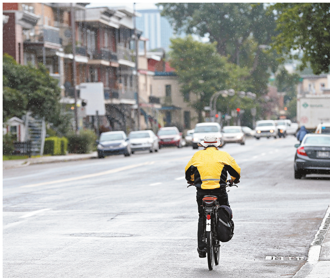
YAN DOUBLET LE DEVOIR

L'administration Labeaume souhaite accélérer la cadence dans le développement du réseau cyclable.