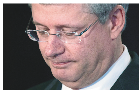
Le premier ministre Stephen Harper

Le premier ministre a beau avoir annoncé, depuis Bruxelles, un accord de libre-échange avec l'Europe, le jour même à Ottawa les sénateurs approuvaient que les conservateurs propo-