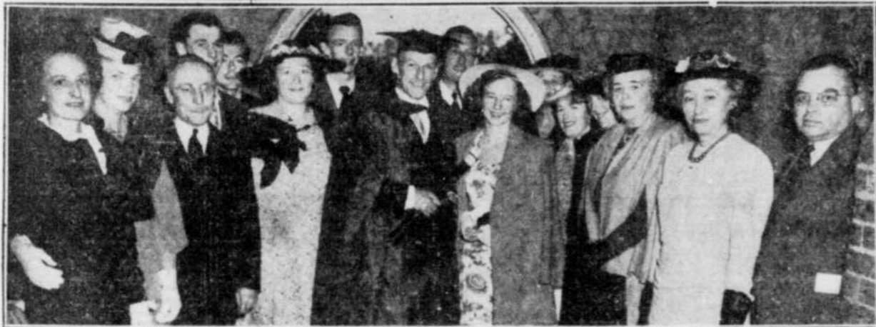
Les photos ci-dessus ont été prises hier après-midi après la cérémonie de collation des diplômes à l'Université Bishop...