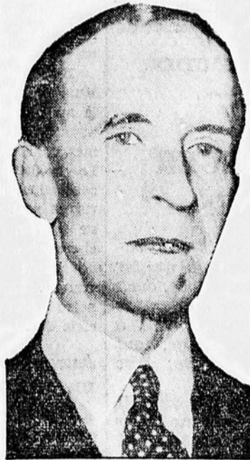
Son Excellence Lord TWEEDSMUIR, qui présidera cet après-midi à l'inauguration du manège militaire Salaberry.