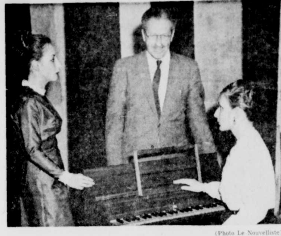
LES COMPAGNONS NOTRE-DAME ont patronné un récital de mélodies médiévales et de la Renaissance, samedi dernier, à leur théâtre du Parc de l'Exposition.