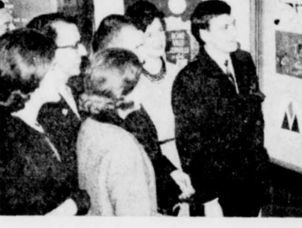
UNE EXPOSITION D'ART GRAPHIQUE s'est ouverte, samedi soir, au hall du Séminaire St-Joseph de Trois-Rivières, sous les auspices du Centre d'Art et de l'Institut de Culture populaire.