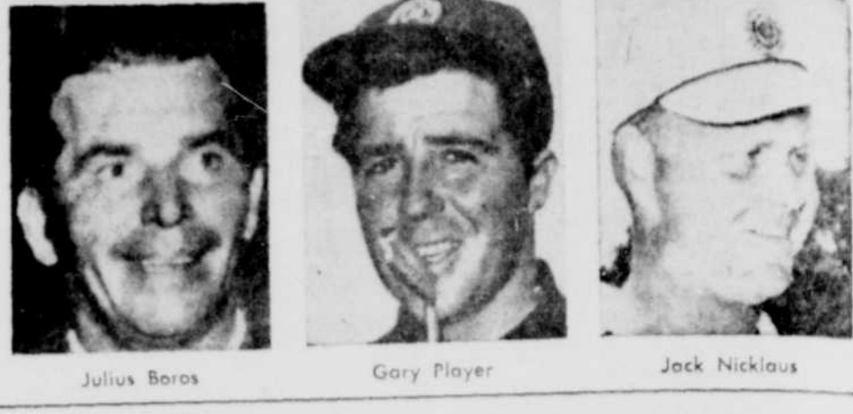
Julius Boros Gary Player Jack Nicklaus