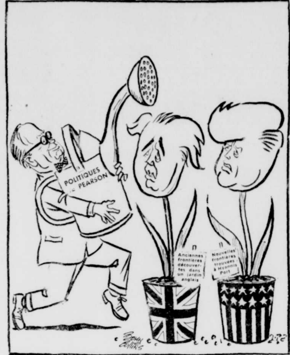
Les fleurs de mai