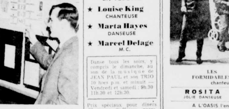
UNE EXPOSITION D'ART GRAPHIQUE s'est ouverte, samedi soir, au hall du Séminaire St-Joseph de Trois-Rivières, sous les auspices du Centre d'Art et de l'Institut de Culture populaire.